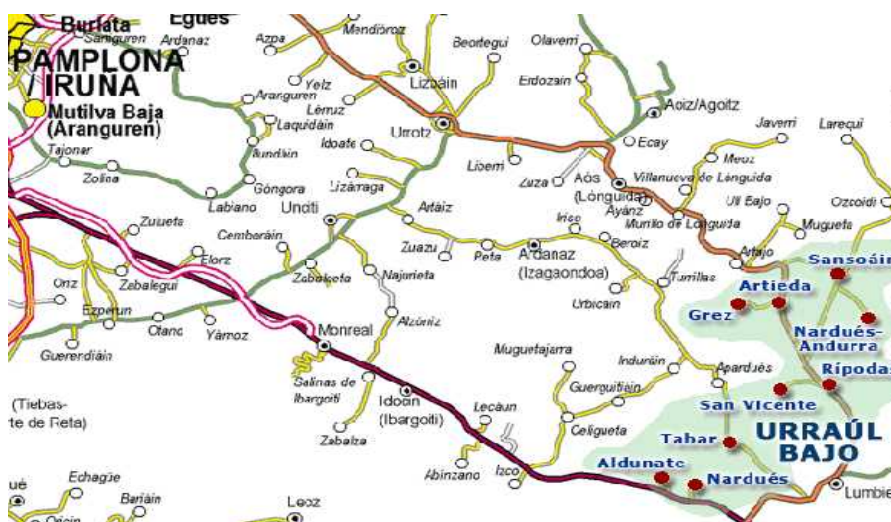
Mapa del Municipi d'Urraulbeiti. Font: Sistema de Informació Urbanística de Navarra