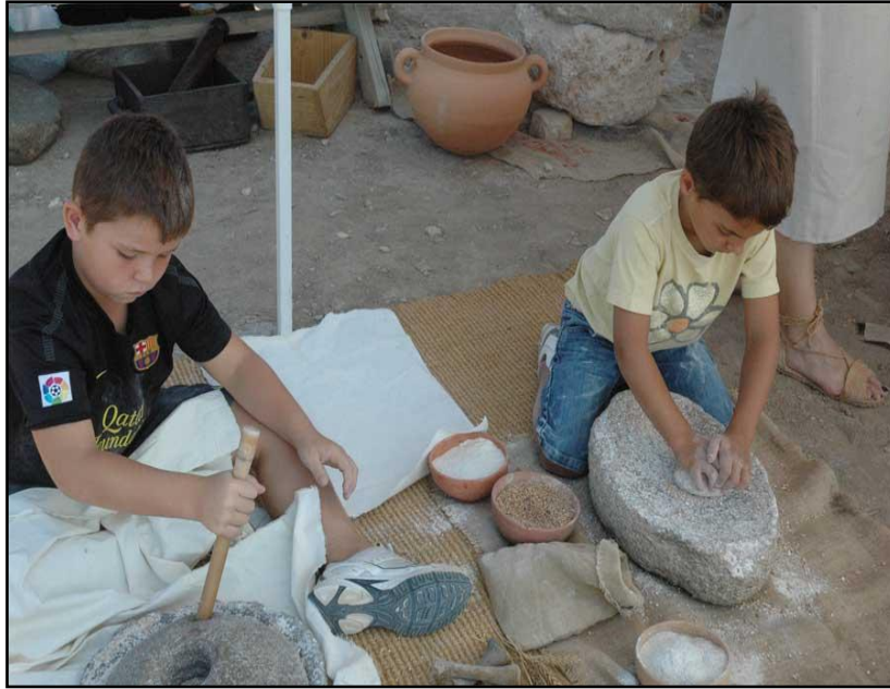
Figura 15. Escolars realitzant activitats de molta en el jaciment dels Vilars.