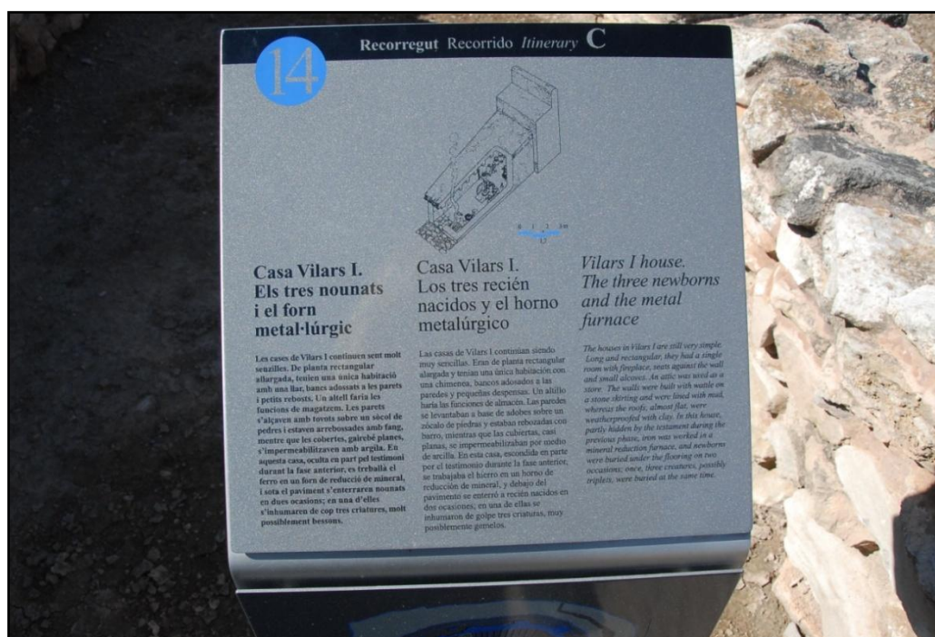
Figura 6. Panells informatius escrits en català, castellà i anglès.

En l'actualitat el conjunt arqueològic està condicionat per a visites. Cal esmentar, però, que tot i l'encertada col·locació d'un ferm de ferro al llarg del recorregut, el jaciment no compta amb una accessibilitat adequada per a persones amb mobilitat reduïda. La visita es pot realitzar seguint tres itineraris de visita: l'exterior, el fossat i l'interior del recinte. Al llarg del recorregut es van trobant panells d'informació general i nexes d'unió amb la Ruta dels Ibers , així com també, vint elements de senyalització puntual (faristols escrits en català, castellà i anglès) (Fig.6). Es pot visualitzar també el testimoni de l'antic tell amb les seves fases estratigràfiques. Per facilitar el recorregut s'han incorporat tot un seguit d'infraestructures i elements mobles, consistents en sistemes d'il·luminació, una passarel·la sobre el fossat d'accés de la porta nord (formigó, ferro i fusta) (Fig.7), una escala, taula i plataforma d'orientació, un mirador sobre el pou (Fig.8), així com també un ferm de peces prefabricades acoblades sobre el llit de grava i geotèxtil, esmentat anteriorment (Fig.9).