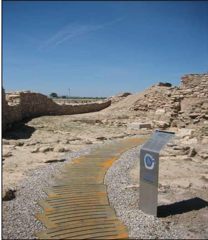
Figura 9. Ferm de ferro sobre llit de grava que marca l'itinerari.