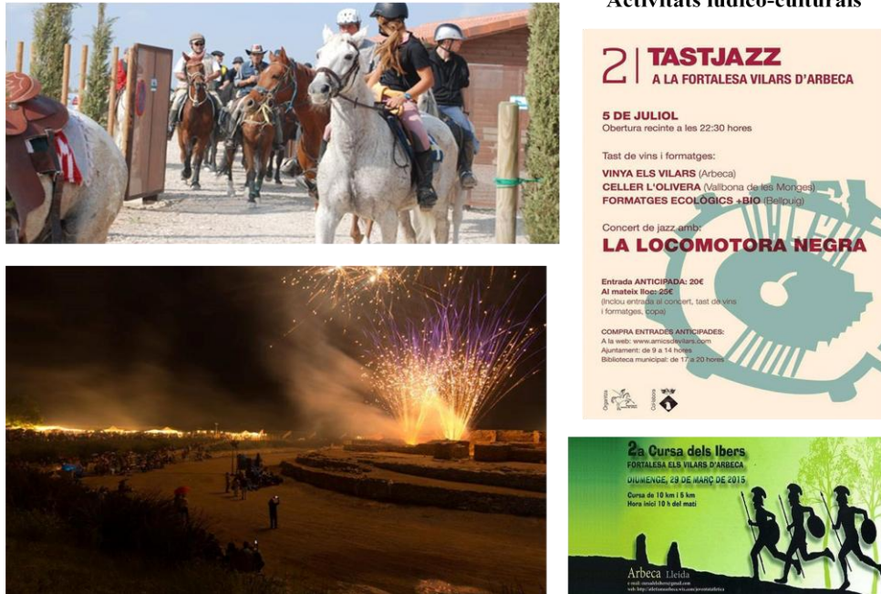
Figura 16. Activitats ludico-culturals organitzades per l'associació Amics dels Vilars.

que és una forma de sensibilitzar la societat i que aquesta s'apropii el patrimoni, el reivindiqui com un dret i l'incorpori en la seva vida quotidiana (Figs.16 i 17).