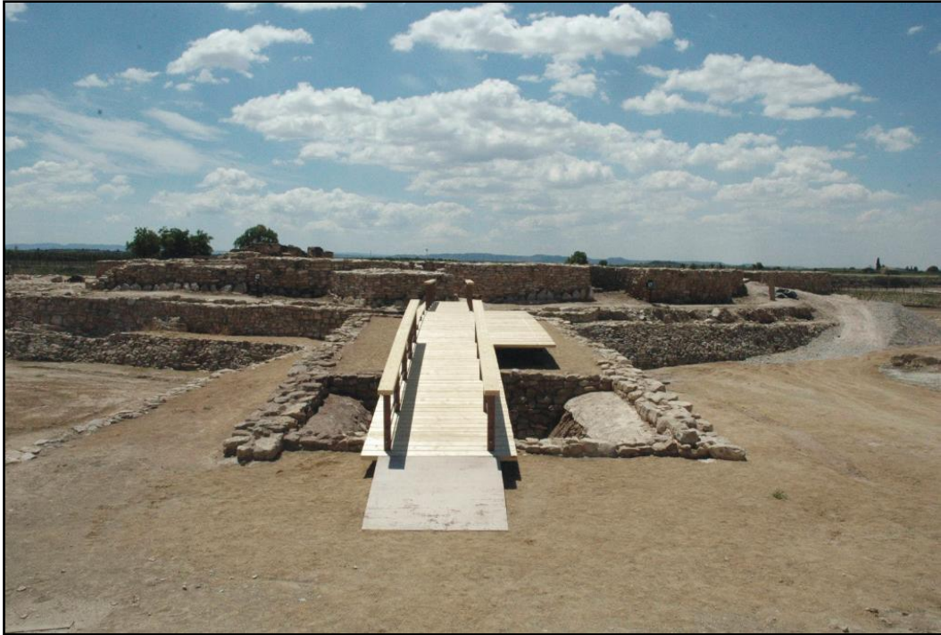
Figura 7. Passarel·la sobre la rampa d'accés a la porta nord.