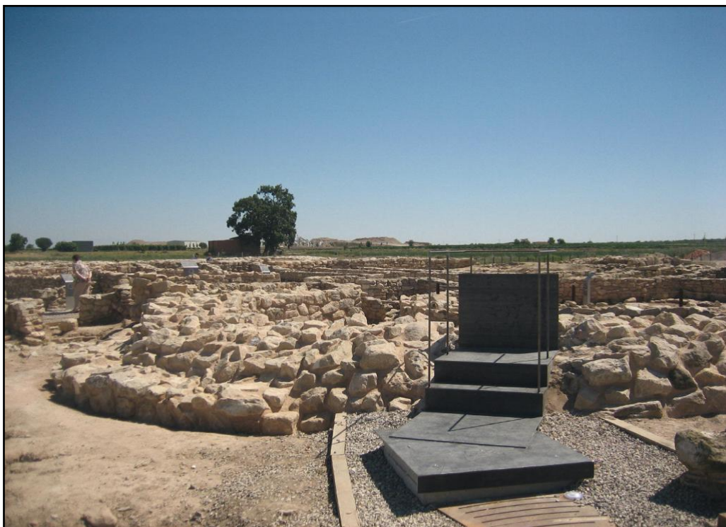
Figura 8. Mirador sobre el pou central.