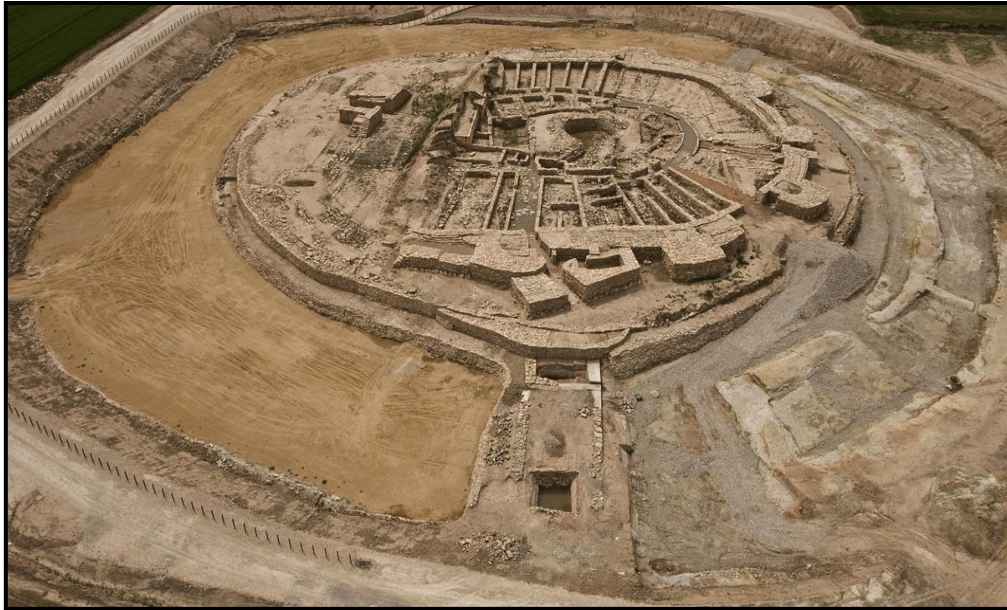
Figura 3. Panoràmica aèria del jaciment.

Després de cinc anys d'excavació en extensió (1993-1998), l'any 1998 va ser declarada bé cultural d'interès nacional en la categoria de zona arqueològica per la Generalitat de Catalunya (DOGC 2673, 98/07/03). A partir d'aquest moment els treballs de consolidació i restauració passaren a ser prioritaris. Amb la redacció l'any 2001 del Pla Director Vilars 2000 va iniciar-se un procés de treball intens amb l'objectiu de contribuir decisivament a revelar l'exceptional monumentalitat de la fortificació.