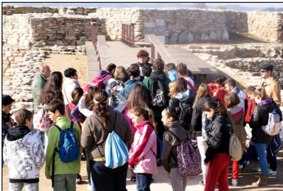
Figura 14. Grup d'escolars visitant el jaciment.