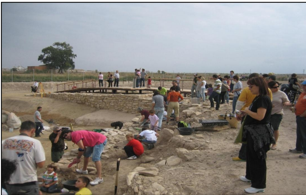
Figura 17. Taller d'Arqueologia organitzat pel GIP (UdL) i l'Associació Amics dels Vilars.