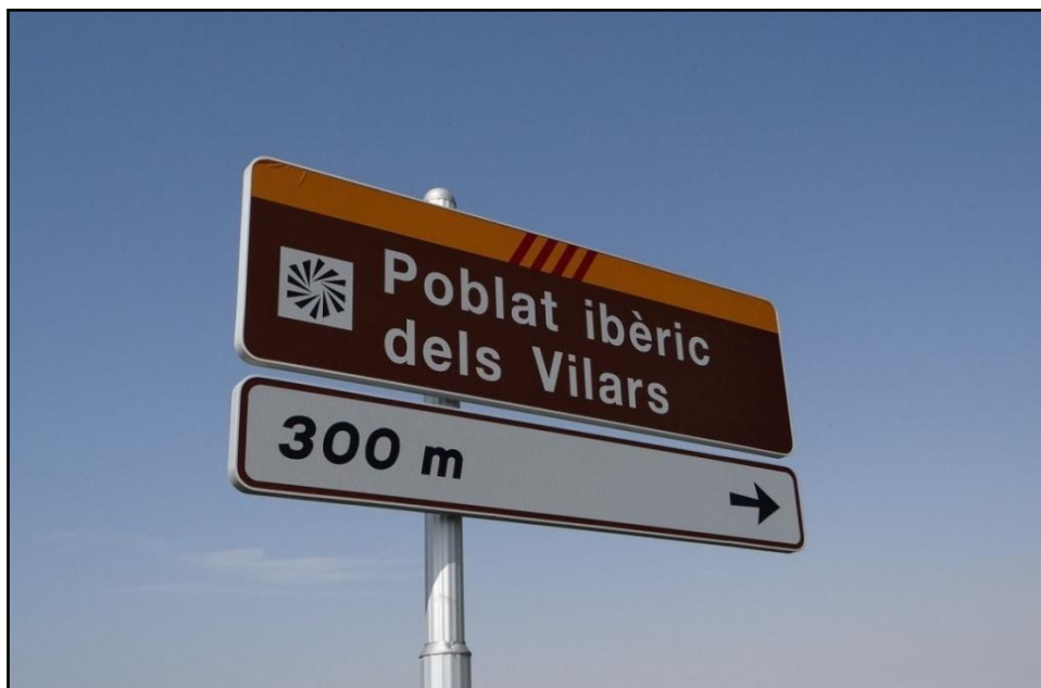
Figura 11. Senyalització del jaciment en la principal via d'accés.

La situació enmig de la plana en facilita l'accés, el qual es realitza aprofitant el parcel·lari agrícola. Tot i que, l'accés des del poble d'Arbeca es realitza per un camí degudament senyalitzat (Fig.11) i asfaltat que voreja el canal d'Urgell, en un futur els accessos haurien de millorar notablement, ja que, el camí permet el pas d'autocars però el seu encreuament no és fàcil.