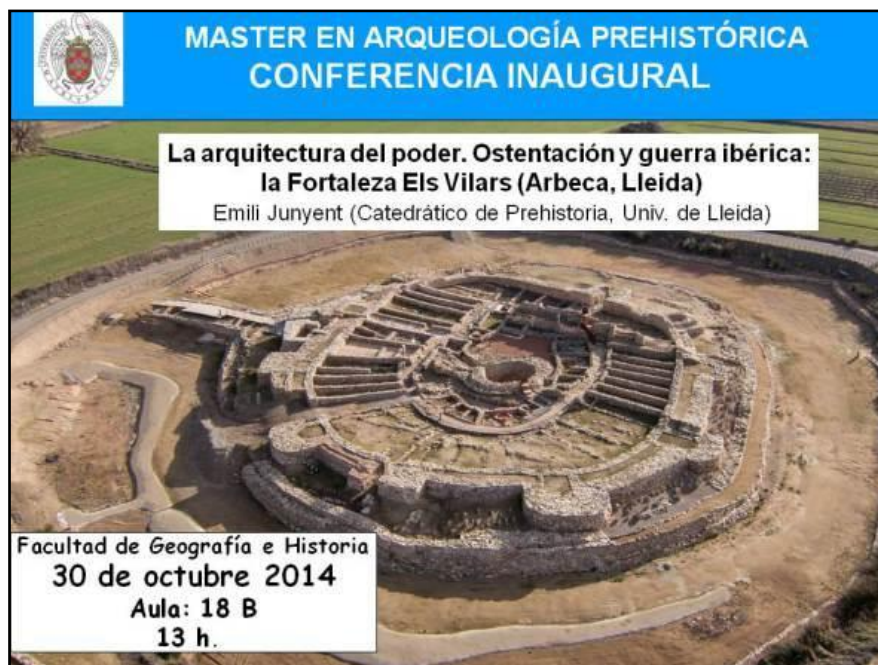
Figura 12. Fulletó anunciant la Conferència Inaugural del Màster.