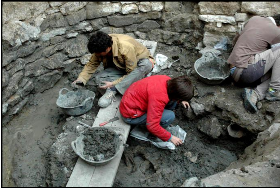
Figura 2. Treballs d'excavació de la campanya 2013.

Es tracta d'una fortificació única en el panorama peninsular i europeu de la Primera edat del ferro i de l'arqueologia ibèrica. La Fortalesa dels Vilars d'Arbeca (Arbeca, Les Garrigues) es va començar a construir durant la Primera edat del ferro, cap al 750 a.n.e. i va ser abandonada cap al 300 a.n.e. (Fig. 3). A través de l'estratigrafia interna s'hi poden distingir dos horitzons diferenciats (Junyent i Casals, 2011):