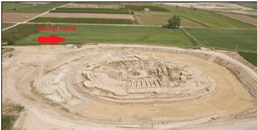
Figura 4. Sector nord, interessos actuals i futurs de la recerca.

Els interessos futurs se centren en poder realitzar intervencions en el sector nord (Fig.4). Actualment és un camp de cultiu, sota el qual, mitjançant prospeccions geofísiques s'ha pogut intuir el canal d'alimentació del sistema de fossats, sembla ser que seria el curs antic d'aigua de l'Aixaragall, així com també, el fossat avançat, la part davantera de la rampa d'accés i la contraguàrdia o defensa de l'entrada de la rampa. Per poder realitzar aquestes actuacions s'hauria d'expropiar el camp de cultiu al propietari del terreny, procediment que requereix de l'acció de l'Administració, tràmits que no sempre són de fàcil solució.