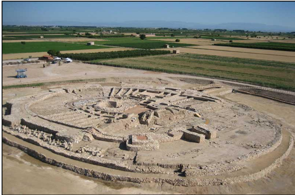
Figura 10. La Fortalesa dels Vilars en el territori.

La situació enmig de la plana en facilita l'accés, el qual es realitza aprofitant el parcel·lari agrícola. Tot i que, l'accés des del poble d'Arbeca es realitza per un camí degudament senyalitzat (Fig.11) i asfaltat que voreja el canal d'Urgell, en un futur els accessos haurien de millorar notablement, ja que, el camí permet el pas d'autocars però el seu encreuament no és fàcil.