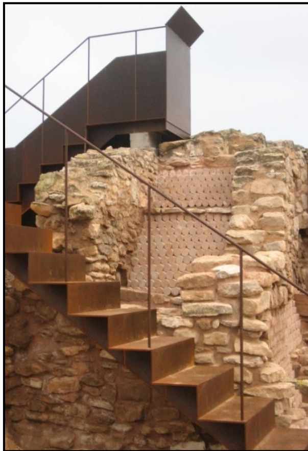
Figura 5. Escala i mirador sobre el tell-testimoni.

A partir de la condició de BCIN i mitjançant el Pla Director Vilars 2000 es va anar definint el model a seguir, és a dir, s'havia de garantir l'autenticitat i el rigor de la consolidació i la restauració, assumint el principi de la intervenció mínima i la diferenciació entre les parts originals i les restaurades; fer intel·ligibles les estructures arqueològiques sense renunciar a recuperar part de la monumentalitat original restituint volums positius (les estructures) i negatius (el fossat); cercar l'empatia amb el públic a través de l'autenticitat, evitant reconstruccions i traslladant la interpretació al museu i les TIC; conservar el testimoni central per visualitzar la superposició estratigràfica i la lectura diacrònica (Fig.5); recuperar el fossat i assegurar zones de reserva científica.