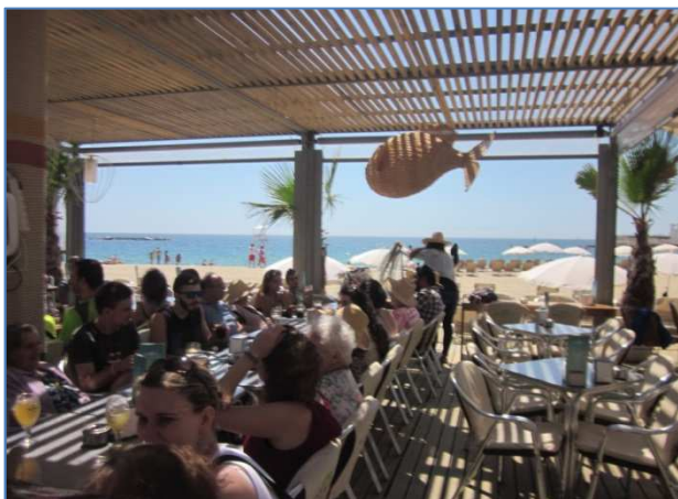
Sortida Xiringuito de la Barceloneta