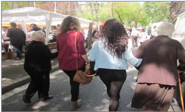
Sortida Diada de Sant Jordi