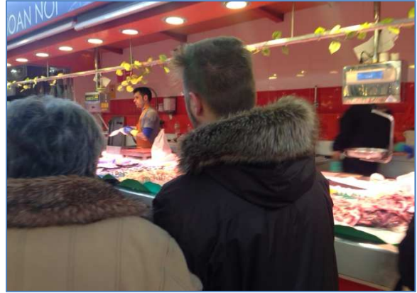
Sortida al Mercat de la Llibertat