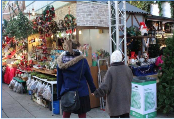
Sortida a la Fira de Santa Llúcia