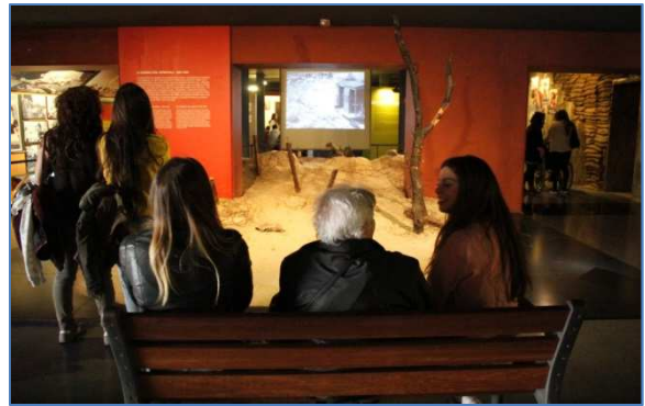
Sortida al museu d'Història de Catalunya