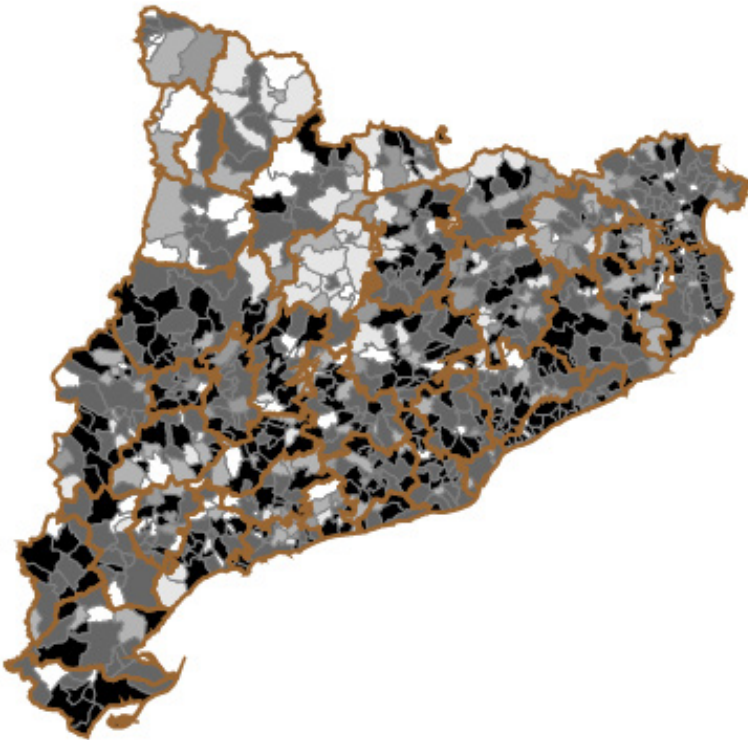
MAPA I. ELECCIONS MUNICIPALS DE 1934. PARTICIPACIÓ PER COMARQUES (EN % DEL CENS)

Nota: hem sumat les dades dels municipis existents el 1934 i que s'han agregat posteriorment; en el cas dels municipis que s'han desagregat posteriorment a aquesta data, hem mantingut el mateix percentatge del municipi mare en els nous municipis.