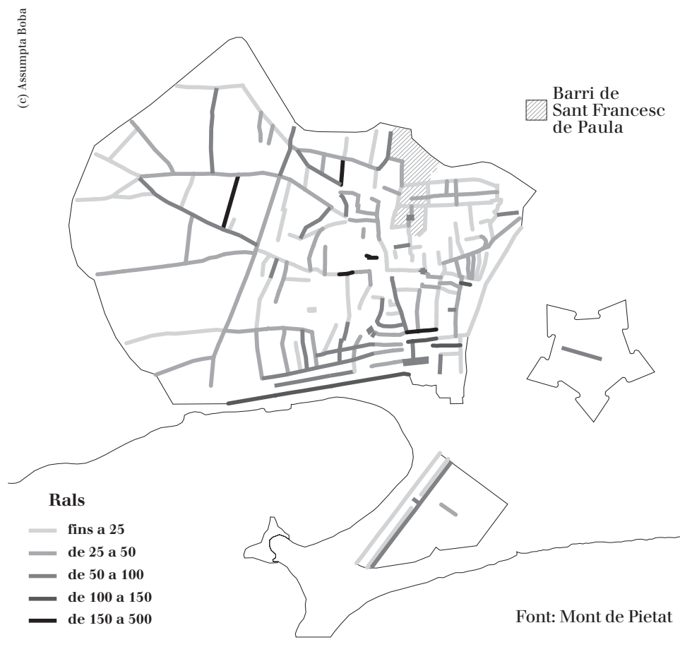
Figura 3. Barcelona 1770. Valor mig dels crèdits per carrer