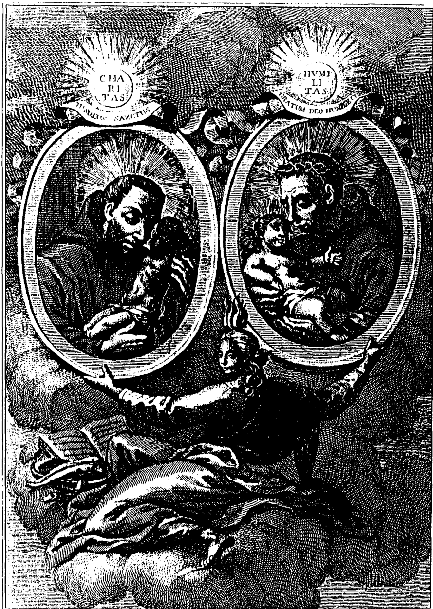
PP. Mestas sculp. Verdaderos Retirados de los BB. Gaspar de Bono Sacerdote, y Nicolas de Longobardis Oblato, ambos de la Sagrada Religion de Minimos de S. Fran. de Paula.