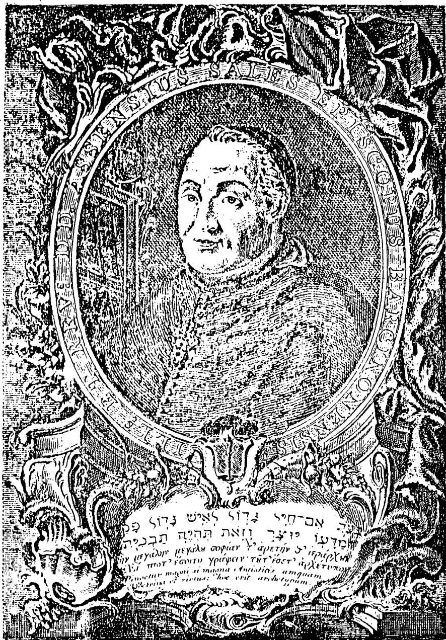
Vincentius Calveran delon. et sculp. Valentius in A. doctus. 1761.