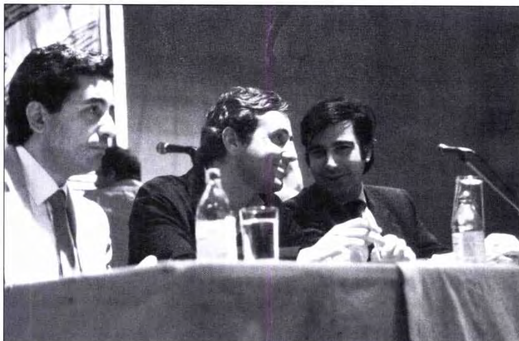
Amb Raimon Obiols en un acte polític.