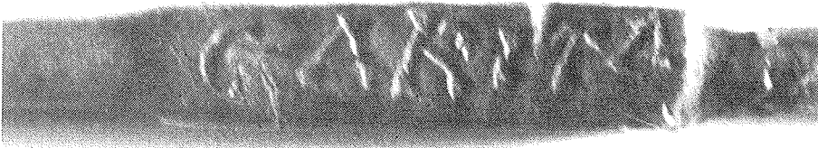
FIG. 5: CARA D DE LA INSCRIPCIÓ