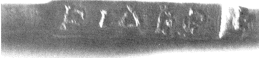
FIG. 4: CARA C DE LA INSCRIPCIÓ