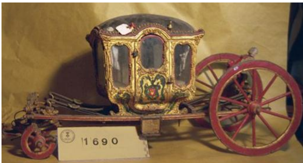
Fig. 8. Carruaje de juguete. Siglo XVIII. Museu Palau Mercader/Ajuntament de Cornellà de Llobregat.

De alguna manera, aquellos que eran dueños de una carroza o carruaje marcaban una frontera con aquellos otros que no podían permitírsela, ya que alcanzaban la posibilidad de una mayor libertad de movimiento. Por eso no es de extrañar que en cualquier ceremonia familiar importante los miembros de la nobleza que no tenían optaran por alquilarlo durante algunas horas o días. Y no olvidemos que la propiedad de un rico carruaje formaba parte de la escenografía cotidiana de muchas estampas familiares y ciudadanas. (Fig. 8) La aparición de un lujoso coche de caballos por las calles de Barcelona indicaba a los peatones el desplazamiento de una u otra familia o personaje importante dentro de esta pequeña sociedad. Martin Zeller, en su libro Hispaniae et Lusitaniae Itinerarium , publicado en 1637, recoge que cualquier persona de importancia se movía en caballo o coche de caballos. Apuntaba, además, que en Barcelona cada noche cuando el tiempo era propicio la gente salía a pasar con carruaje junto al mar, participando en ello más de cien coches 23 . Si bien sea conveniente ser prudentes respecto a la cantidad de carruajes existentes según el alemán en la ciudad, no deja de ser interesante su comentario pues demuestra el gusto por la ostentación y exhibición a través de su uso.