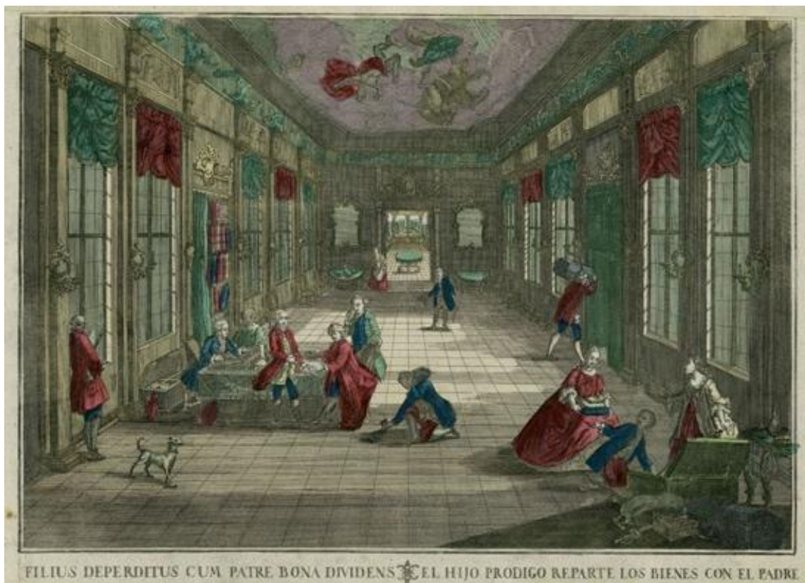
Fig. 1. El hijo prodigo reparte los bienes con el padre . Colección particular.

En el deseo de cualquier individuo de ser visto de una determinada manera- con admiración, temor, ternura, respeto, devoción o cualquiera de los muchos adjetivos posibles – juega un papel fundamental la construcción, consciente o inconsciente, que se hace de la propia imagen. Aun así, en la primera mitad del siglo XVIII, la apariencia individual se hallaba fuertemente arraigada a la imagen familiar. En esta “composición” de diferenciación o aproximación al resto de los miembros en que se inscriben las relaciones cotidianas, el individuo y muy especialmente la familia, concebida como elemento de transmisión del linaje, tiene en los actos de vestir el cuerpo y acondicionar sus viviendas una herramienta de gran utilidad para proyectar escogidas impresiones. La casa y el cuerpo, aspecto este último que no abordaremos en el presente artículo, toman una carga simbólica fundamental, puesto que acontecen imágenes calladas que nos revelan las maneras de estar y posicionarse de sus moradores. Espacios de observación y de acción, de distinción y también de diferenciación, (Fig.1) donde el lujo jugaba un papel esencial que las pragmáticas no pudieron frenar 1 .