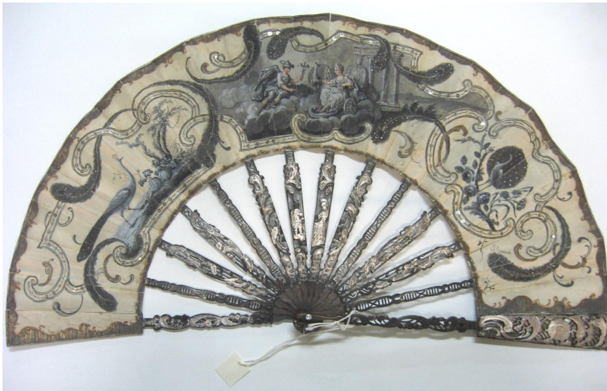
Fig. 2. Abanico de luto. Manufactura francesa. Museu del Disseny de Barcelona.