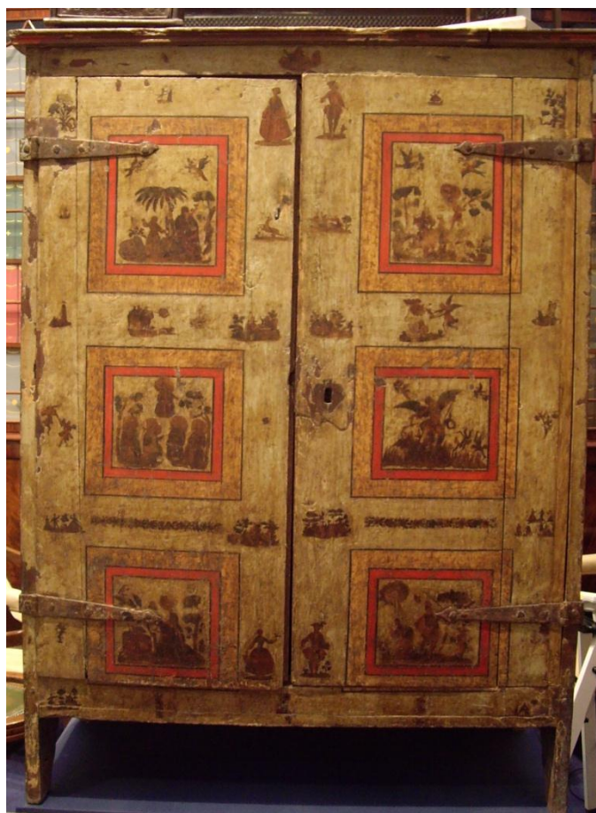
Fig. 5. Armario decorado con laca povera . Colección particular.

La aproximación a los artefactos suntuosos que vestían las casas principales de la ciudad no estaría completa si no se abordaran las manufacturas fabricadas en la ciudad. Abandonando los mercados exteriores, los talleres de la ciudad ofrecían, siguiendo las corrientes imperantes, un buen surtido de artículos tal y como lo demuestran los gastos hechos, por ejemplo, por el Duque de Sessa. Para alejarnos de la confección de un catálogo de tipologías mobiliario de las compras realizadas por Don José de Guzmán Vélez, Ladrón de Guebara y Tassis, Enriquez, Porras, marqués de Montealegre, Quintana, conde de Oñate, Villamediana, Camporreal, duque de Soma y Baena, conde de Cabra y Palamós, hidalgo de cámara del monarca, también conocido popularmente como duque de Sessa, quisiéramos abordar un único encargo como paradigma de lo que fue la adquisición de un artefacto lujoso en los talleres de la ciudad, que demuestran el nivel artístico de los mismos. Así pues de la larga lista de muebles comprados - en el campo del menaje doméstico encomendó varios artículos, especialmente camas y asientos, además de piezas de ropa para la capilla y tapicerías por el mobiliario - pensamos que la confección de la cama ala imperial, que fue entregada en Madrid en 1755 es sintomática de lo que se ha ido exponiendo hasta el momento.