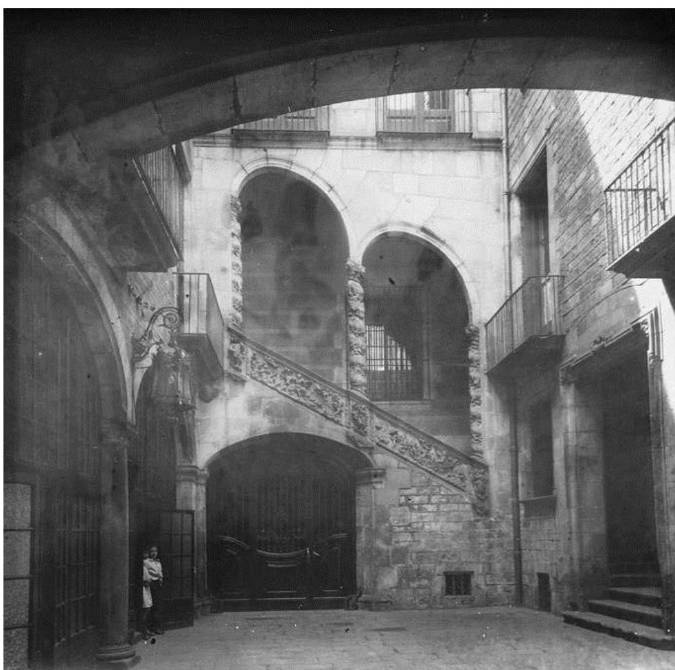
Fig. 3. Entrada de la casa gran de la noble familia Dalmases. Carrer Moncada, Barcelona, Biblioteca de Catalunya.

donde representar un rol social, y en otros más simples, reducto de privacidad. Una primera frontera entre estos dos tipos de escenarios que convivían en un mismo hogar aristocrático venía dada por su propia ubicación en diferentes plantas, ya que se reservaba la principal o noble a las actividades sociales y se disponían los pisos superiores para cámaras de uso particular, donde solía reinar un cierto desorden compositivo. (Fig. 3) Dada la gran cantidad de estancias que podía llegar a alcanzar una vivienda aristocrática, fue un hecho común que se las denominara con nombres que singularizan el espacio respecto al resto de cámaras de la casa, nombres que, por otra parte, solían hacer referencia a los artefactos o menaje rico que contenían y las distinguían del resto, como la sala de las escaparatas , o, incluso, al uso que de ellas se hacía, como el “cuarto de las mujeres” en el hogar de los condes de Múnter.