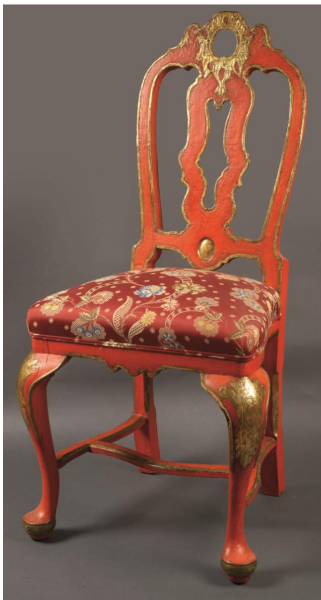
Fig. 4. Silla a la inglesa. Colección particular.