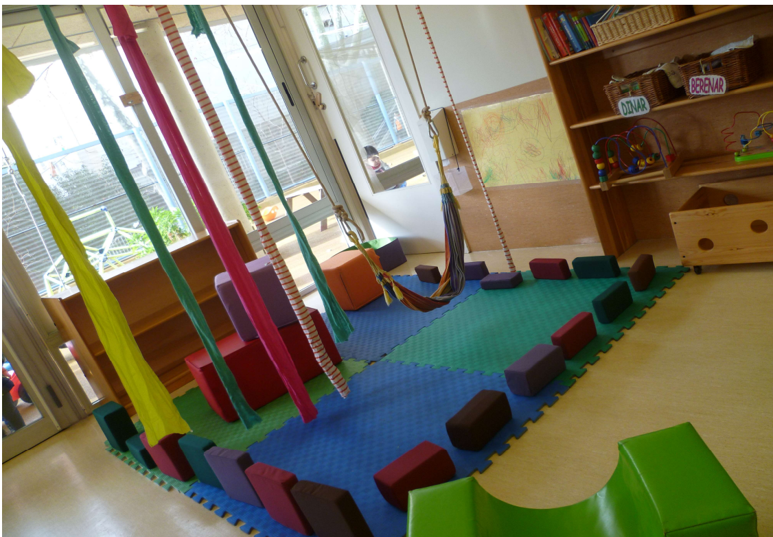
Ambient motriu (cos i moviment)

No és fins al 2on trimestre quan començant a rotar pels diferents espais, alternant els 3 grups, de tal manera que puguin passar un dia a la setmana per cada un dels 3 espais preparats, sempre acompanyats/des per la seva educadora.