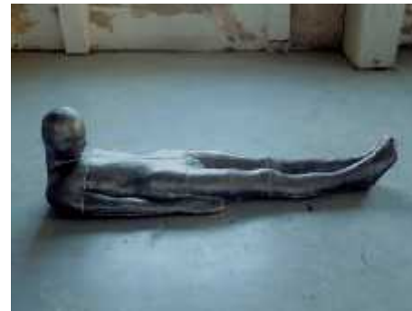
Fig.23. Plateau , 1985-1986