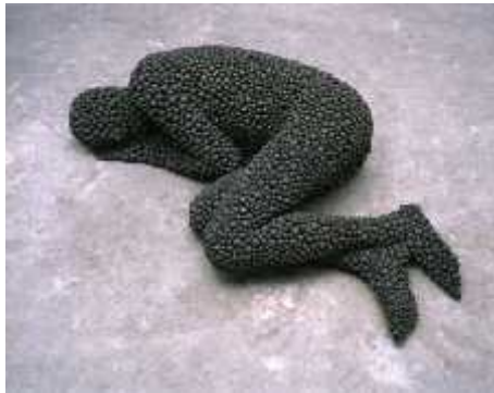
Fig.21. Bodies at rest I , 2000

Antony gormley. El cultural. “La escultura aspira a ser estable, a continuar su lugar. 2002