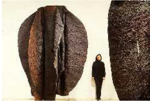
Fig.28. Brown Abakans , 1969/1972

Magdalena Abakanowicz, A partir de la declaració realitzada durant l'acte de conferir-li el Premi de la International Sculpture Center for the Life Achievements New York ,2005