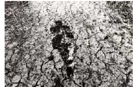
Fig.35. Sèries Silueta, Untitled , 1978