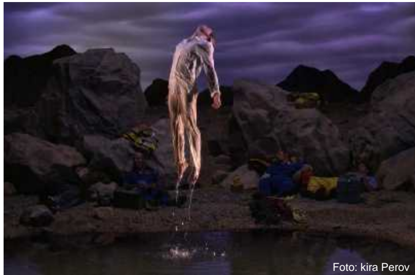
Fig.31. First Light , 2002

Bill Viola, entrevista festival IBAFF(Murcia), 2013