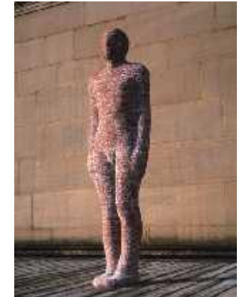
Fig.24. The brick man , 1987