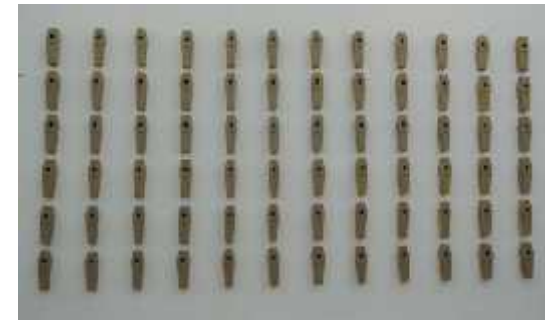
Fig. 18-19-20. Instal·lació. Sense Títol , 2016

Vida i mort cohabituen en un mateix objecte, petites caixes de nius d'ocells però en forma de taüts amb un forat que ens recorda la vida que podria néixer dins d'aquesta caixa de morts. L'obra consta de 72 caixes distribuïdes a la paret construint un espai tancat amb la intenció de donar aparença de nínxols de cementi.