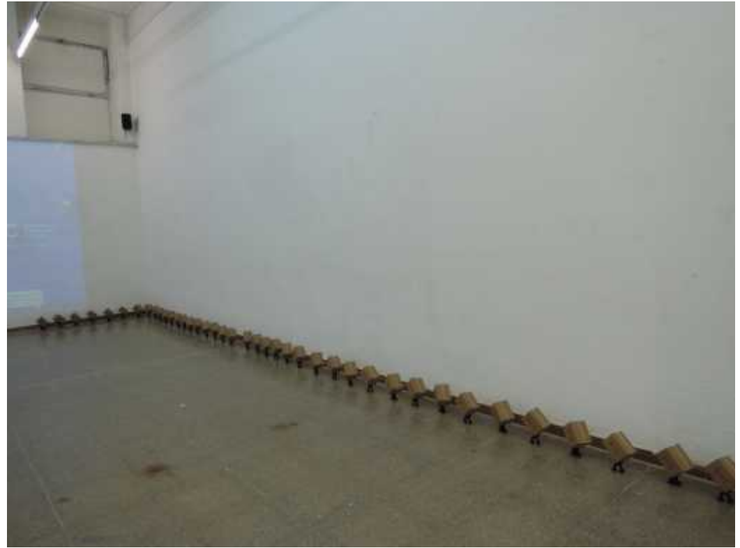
Fig. 13-14 . Instal·lació. La càrrega. , 2016

Analogia entre home i natura, va ser part de la proposta per a la realització d'un dels meus últims treballs en el qual, mitjançant la manera de treballar de les formigues, parlava sobre la càrrega emocional. En aquesta obra redueixo a l'ésser humà a la mida de una formiga per posar-li a l'alçada d'aquests insectes per així potenciar la seva fragilitat i posar èmfasi en el gran pes que porten a sobre, que en el cas d'una persona es tractaria d'una gran càrrega psicològica.