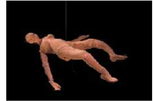
Fig.27. Imatge portada catàleg , 2004