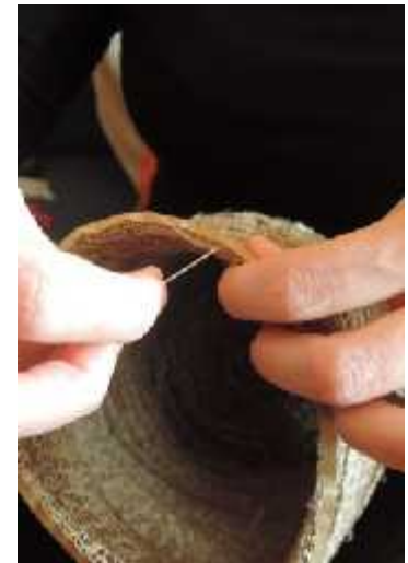
Fig. 39.

He cosit, he descosit i he tornat a cosir en aquest llarg recorregut d'aquest cos humà, i em fa pensar en Penélope 4 que teixia i desteixia aquell sudari de mort i anaven passant els anys, i jo he cosit i a vegades he hagut de descosir quan ja tenia un gran camí fet sobre tot per causa de les proporcions. Tal vegada cada puntada és com anant dibuixant la vida passada, una mena de mort, un ressorgir deixant lligams i anhels en aquesta carcassa que un dia va a aixoplugar a un ésser que necessitava aquesta transformació.