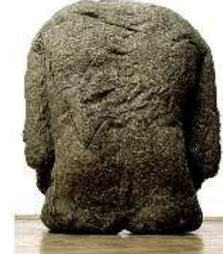
Fig. 30. One of warsaw backs 1976/80