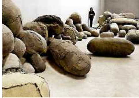
Fig. 29. Embryology , 1980