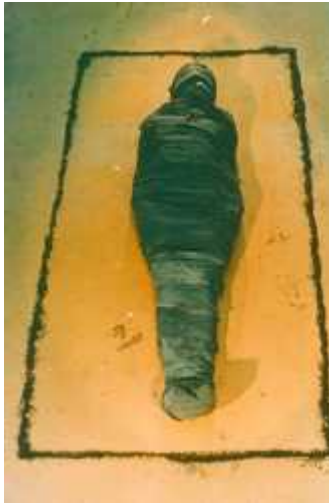
Fig.33.. The Black Ixchell ,1977

Ana Mendieta. “De la inscripción a la disolución: un ensayo sobre el consumo en la obra de Ana Mendieta”