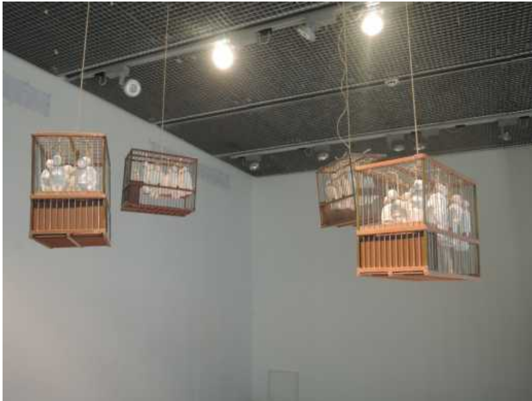
Fig. 15-16-17. Instal·lació. Desesperació , 2016