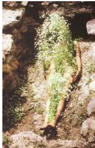
Fig.34. Flowers on body ,1973