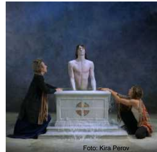
Fig.32. Emergence , 2002