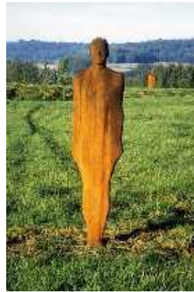
Fig.22. Passage , 2000