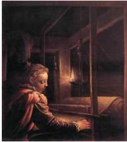
Fig. 38. Leandro Bassano. Penélope (1575-1585).

He cosit, he descosit i he tornat a cosir en aquest llarg recorregut d'aquest cos humà, i em fa pensar en Penélope 4 que teixia i desteixia aquell sudari de mort i anaven passant els anys, i jo he cosit i a vegades he hagut de descosir quan ja tenia un gran camí fet sobre tot per causa de les proporcions. Tal vegada cada puntada és com anant dibuixant la vida passada, una mena de mort, un ressorgir deixant lligams i anhels en aquesta carcassa que un dia va a aixoplugar a un ésser que necessitava aquesta transformació.