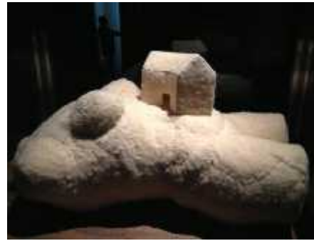
Fig.26. Femme maison , 2001