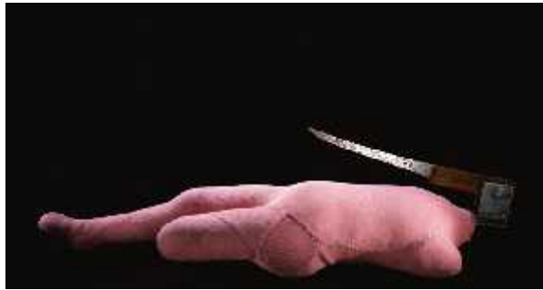
Fig.25. Knife figure , 2002.

Louise Bourgeois. Escritos de Louise Bourgeois. Arte Hoy. Patricia Mayayo. 2002. Pag. 91