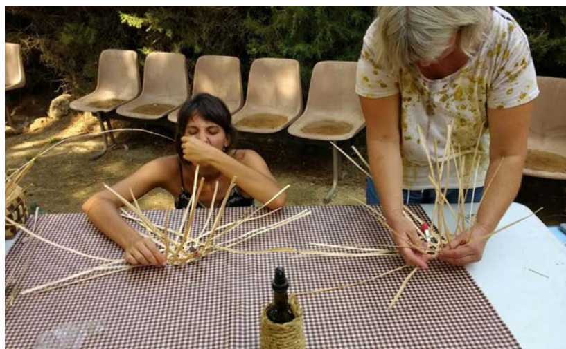
A dalt: Taller Nanses Humanes al Drap Art'16, Plaça dels Àngels, Barcelona. A sota Taller de construcció de barret vietnamita. Experiències cistelleres .