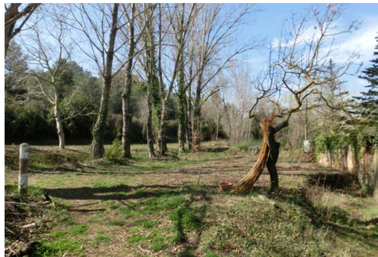
De dalt a baix: Font de les Tàpies, Calders. Maqueta de la intervenció Aviari de l'apropament al Forn de la Calç, CACIS, Calders. Entorn de Ca l'Oliver amb un feix de vímets al fons, Sant Quintí de Mediona.