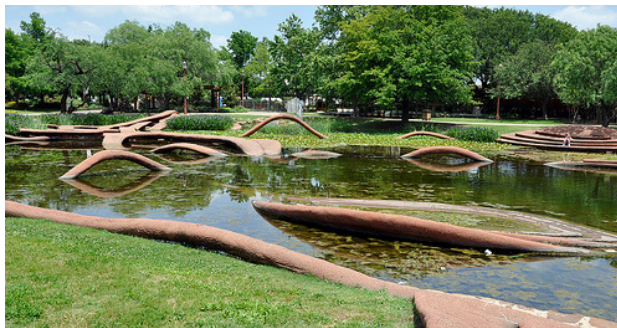
Patricia Johanson, Fair Park Lagoon , Texas.

de memòria històrica, alhora que necessitats mediambientals. La seva pràctica ajuda a restaurar la continuïtat i connectivitat dels sistemes naturals en el teixit urbà. Crea condicions que permeten a les espècies en perill d'extinció prosperar en ple centre urbà, alhora que dissenys on els nens poden jugar, paisatges multifuncionals i d'inclusió social. La majoria dels seus projectes estan ubicats en les principals ciutats i dissenyats en conjunt amb la infraestructura de carreteres, sistemes de drenatge i inundacions. Destacar Fair Park Lagoon, projecte encarregat per el Museu d'Art de Dallas per revitalitzar la llacuna de Fair Park, un espai que estava degradat i que ha sigut sotmès a un procés de regeneració hidrobiològica.