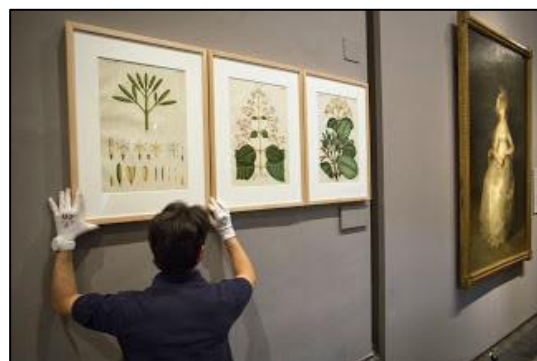
Muntatge d'una exposició a les sales del Museu 4