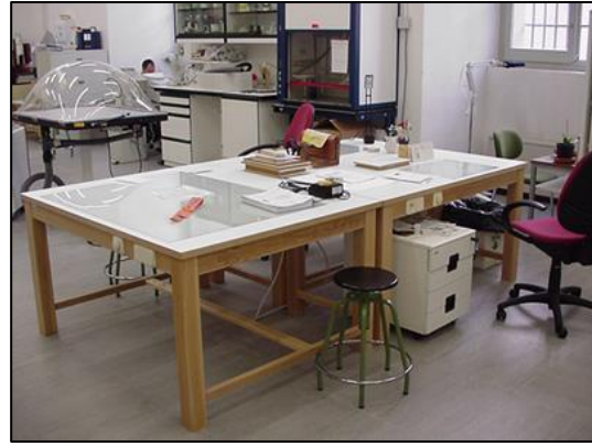
Taller de restauració de paper de la Biblioteca de la UCM 7

Munten exposicions temporals en el vestíbul de l'edifici on es troben, on també hi ha la biblioteca. Són exposicions dels fons mateixos de la biblioteca que gestionen des del taller. Es fan 3 o 4 exposicions l'any.