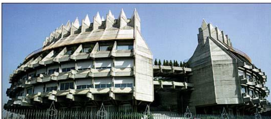
Instituto de Patrimonio Cultural de España (IPCE) 5

Aquest centre està molt conscienciat de la importància de la recerca i la difusió, i fa conferències, jornades i cursos per a professionals habitualment.