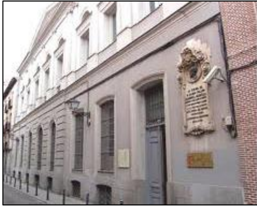
Biblioteca Histórica Marqués de Valdecilla. Universidad Complutense 6