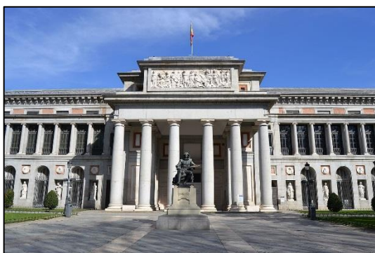
Museo Nacional del Prado 3

Gran part de la seva feina està destinada a preparar les obres per a la seva exhibició en les sales ja sigui del propi museu, o en altres museus. Les obres s'emmarquen amb materials de conservació adequats per a cada cas. Si les obres es deixen en préstec per a exposicions fora del museu, el personal del taller s'encarrega de preparar les obres per al transport en caixes de conservació que assegurin les bones condicions en el trasllat per tal d'evitar que les obres puguin patir danys mentre viatgen. Ells mateixos fan de correus acompanyant les obres i supervisant el desembalat d'aquestes a l'arribada a destí. Comproven també la correcta instal·lació de les peces en el nou museu: ubicació i condicions climàtiques i ambientals.