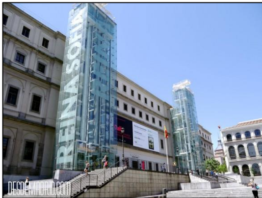
Museo Nacional Centro de Arte Reina Sofía 1

posteriorment. Tots els tallers de restauració tenen a la seva disposició un laboratori químic i una professional química que els assessora i fa analítiques i proves diverses per a les restauracions i estudis de les peces.