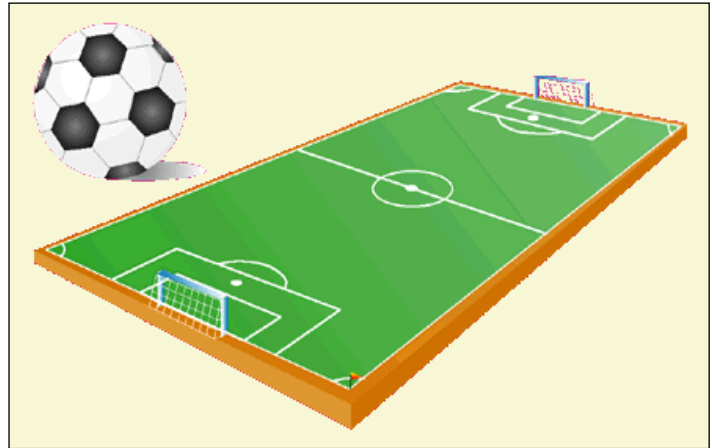
Terreny de joc i pilota de futbol

mateix jugador que tira la falta o per mitjà d'un altre jugador, respectivament. Si la falta castigada amb xut directe s'ha produït dins l'àrea de penal, hom llança un càstig amb la pilota situada en el punt de penal, i només pot defensar la porta el porter, puix que els altres jugadors han de restar tots fora de l'àrea gran. Les competicions de futbol poden ésser jugades per sistema de lliga ↑ o per sistema de copa ↑.