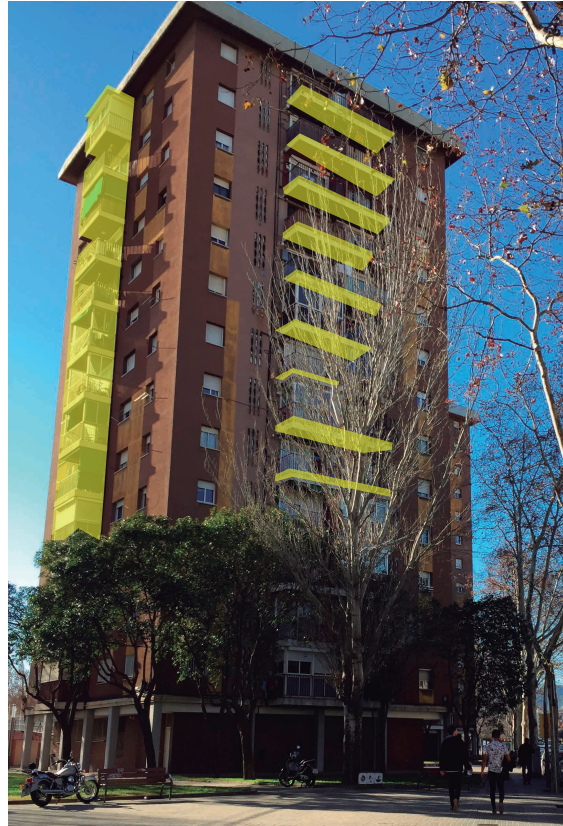
◀▲ Figuras 99 - 100.