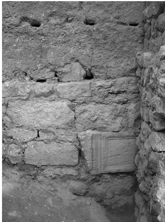
Figura 2. Posición de la inscripción en el lienzo de la muralla.

M(arco) · Calpur= nio Quir(ina tribu) Hermeti M(arcus) · Calpur(nius) · Auctus pater filio piis= simo