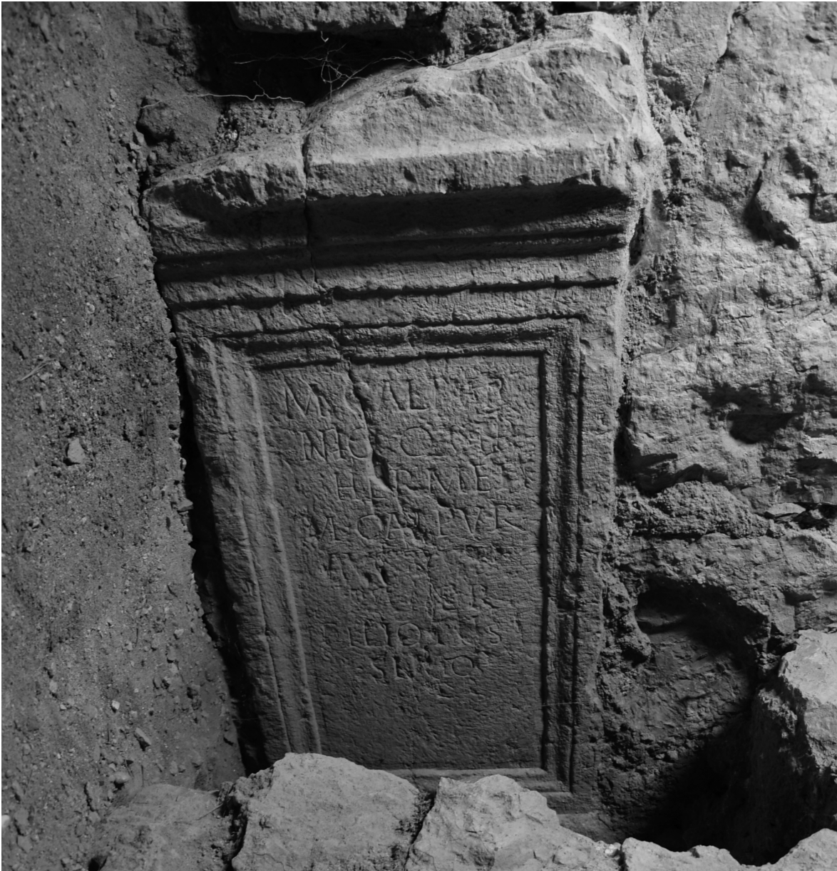
Figura 3. Texto de la inscripción.

Se trata de una inscripción con un formulario relativamente sencillo, tanto por su contenido como por su extensión. En ella se menciona a dos individuos de condición ciudadana: Marcus Calpurnius Hermes , objeto de recuerdo en el texto, y Marcus Calpurnius Auctus , autor de la iniciativa del homenaje. La expresión de la onomástica se limita a los elementos principales: tria nomina e indicación de la tribu, en un caso; tria nomina , en otro. A este último nombre parecería seguir la indicación de una relación de parentesco: en la línea 6 se puede leer la palabra pater , en nominativo, a pesar de la erosión de algunas letras. En cualquier caso, es segura la lectura filio piis/simo en las líneas 7 y 8. Esta mención permitió obviar la inclusión de la fórmula de filiación abreviada normal, en su posición