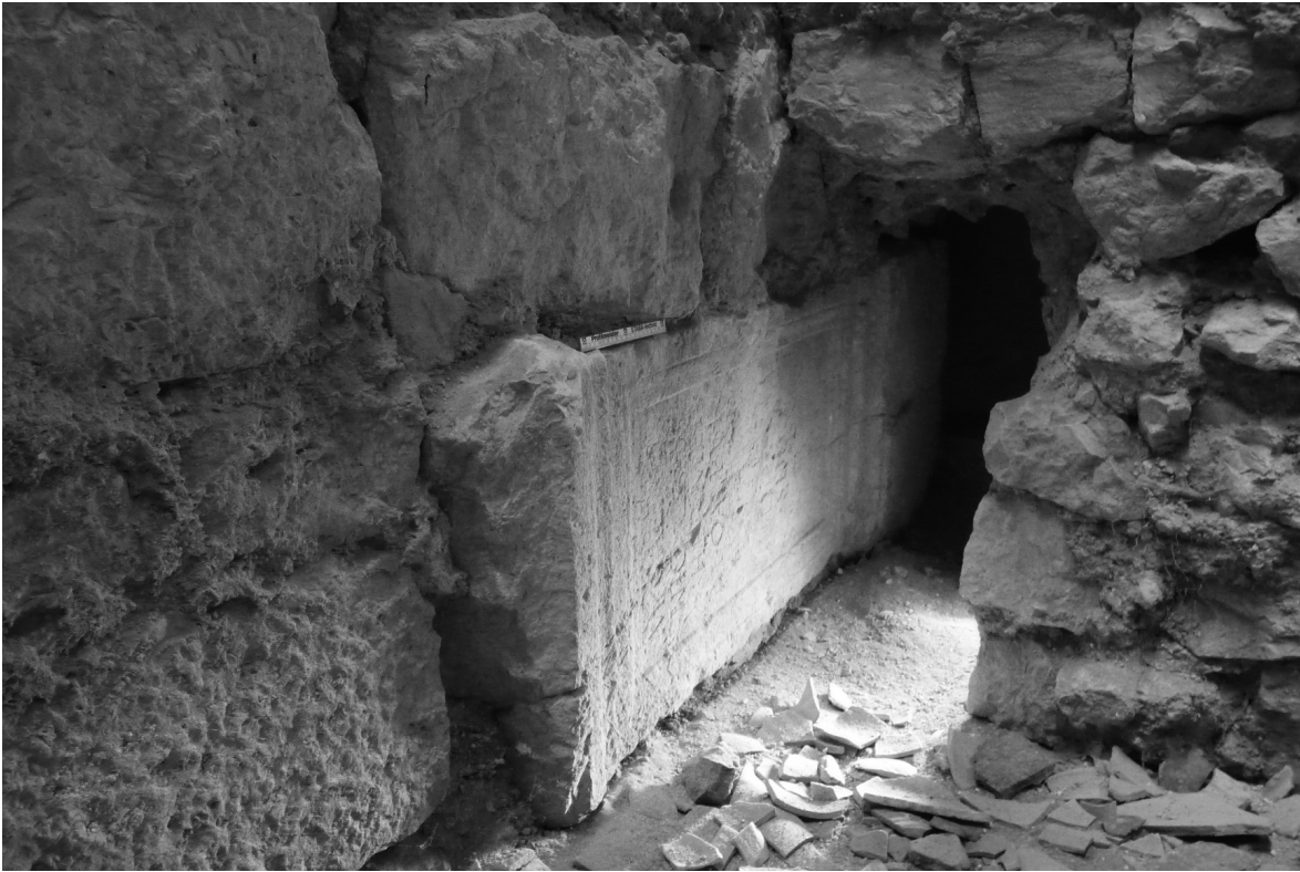
Figura 5. Estado actual de la inscripción.