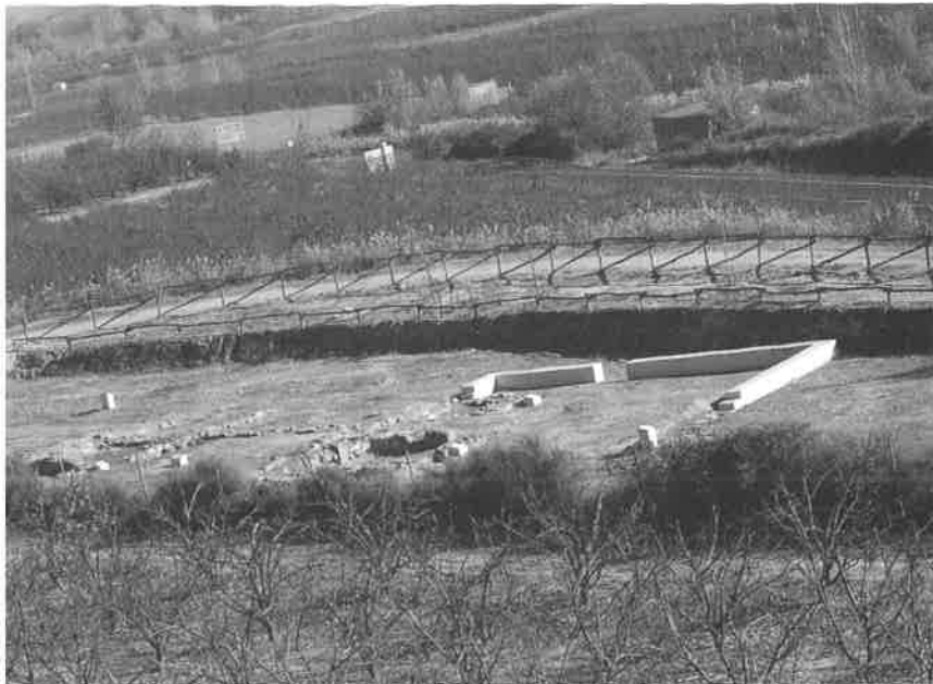
Vil·la del Tossal del Moro de Corbins.

A prop d'aquests edificis, dalt d'un turó se situava un petit cementiri format per un conjunt de tombes molt senzilles que envoltaven un mausoleu. El mausoleu era un