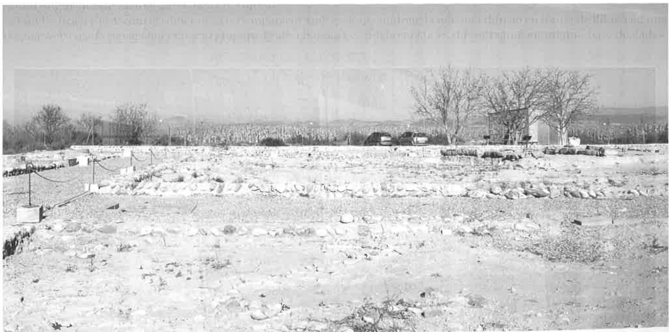
Visió parcial de la vil·la romana del romeral d'Albesa.

Cap el sud-est se situaven altres edificis, també de grans dimensions i bastits amb una tècnica similar de grans carreus. La destrucció o la manca d'excavació d'aquestes construccions impedeix precisar-ne la funció, però segurament també es devien dedicar a la producció agrícola. Un d'ells, en particular, podria haver servit per a l'elaboració de vi o oli, que després es dipositaria en un magatzem a l'aire lliure proper format per grans contenidors semienterrats anomenats dolia . Al sud-oest es va construir un seguit de petites dependències d'arquitectura molt modesta i disposades d'una forma aparentment anàrquica, que van