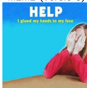
MEME (versió 3)