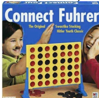
MEME (versió 1)