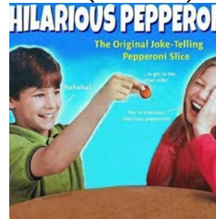
MEME (versió 2)