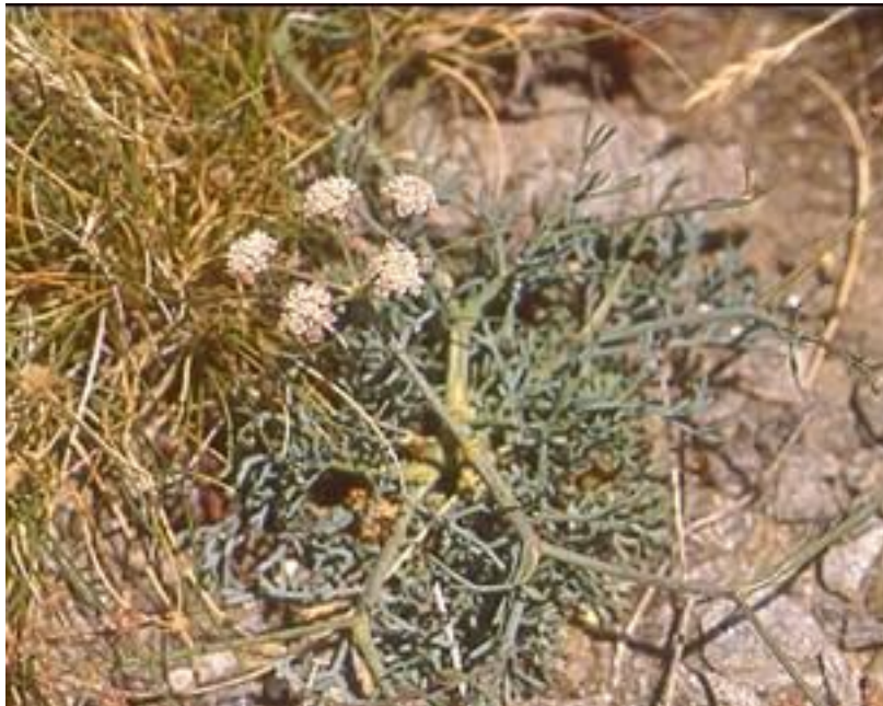
Figura 2.- Seseli farrenyi , un endemisme estudiat pel BioC , que ha estat incorporat al Catálogo de Especies Amenazadas en la categoria "En peligro de Extinción"

C) Canvis de categoria, d'inclusió o d'exclusió, com a conseqüència de les revisions taxonòmiques o de l'estat de conservació, a instància de l'estat o de les comunitats autònomes.