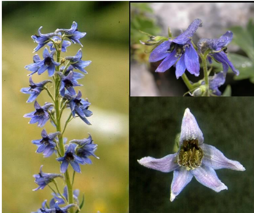
Figura 4. Delphinium montanum ha estat incorporat al Catálogo de Especies Amenazadas en la categoria "Vulnerable". El Portal BioC l'hi ha dedicat un dossier a Planta del Mes

3) La composició de la llista correspon a la proposta de la Generalitat de Catalunya, avalada per la Comissió Assessora de flora i presentada en diverses ocasions, des de fa anys, pels tècnics i responsables del Departament d'Agricultura, Ramaderia i Pesca a les comissions interautonòmiques del ministeri, i respon a una demanda del sector botànic de fa temps, que finalment ha vist la llum (encara que la tardança en les tramitacions han permès considerar només el llistat del primer Catàleg català del D.172/2008 i no la recent actualització, de 2015). El principal argument subjacent de la proposta ha estat l'escassa representació de plantes catalanes al Catálogo inicial (de 2011), que ja provenia, al seu torn, de la migradesa anàloga del Catálogo anterior (dels anys 90), que ara es corregeix. Mentre el Regne d'Espanya segueixi essent l'estat al qual pertany Catalunya, calia disposar per a la nostra flora amenaçada de la mateixa força jurídica, de l'accés a recursos i programes de conservació, etc. que d'altres comunitats espanyoles. Amb aquesta incorporació, que ha trigat molt, es disposa ara d'eines més potents, que caldrà desenvolupar i aplicar per tal que aquesta ampliació de la cobertura legal de la nostra flora amenaçada es tradueixi en una millor conservació efectiva.