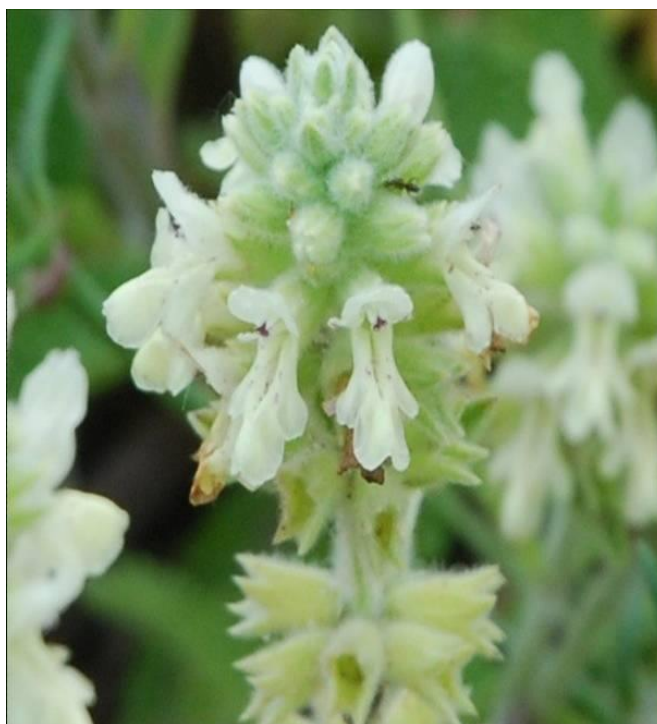
Figura 3. Stachys maritima ha estat incorporat al Catálogo de Especies Amenazadas en la categoria “ En Peligro de Extinción ”. El Portal BioC l’hi ha dedicat un dossier a Planta del Mes