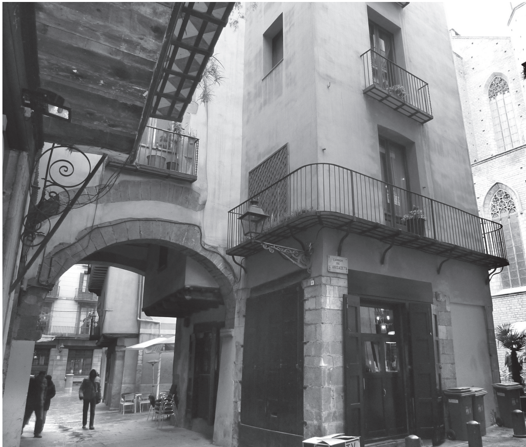
Figura 7. Arcos y estructuras abovedadas en la calle Caputxes.

calle, y bóvedas dels Encants, también desaparecidas, en la calle del Consolat del Mar; 33 aún en pie: dos bóvedas en la calle Arc de Sant Vicenç, dos bóvedas en la calle Volta dels Tamborets, una bóveda en la calle Caputxes, una bóveda en la calle Volta d'en Bufanalla, y otra en la calle Volta d'en Dusai. Es cierto que en otros puntos del casco antiguo de Barcelona se ha conservado bóvedas, pero no con la densidad que presentan las aquí expuestas. A ello se suma la noticia de galerías a modo de puente que circulaban entre Santa María y sus alrededores y que aún eran visibles a principios del siglo xx. 34 Si bien es conocido que estas bóvedas, galerías, arcos y puentes son propios del urbanismo de la Baja Edad Media, su especial concentración en la zona que estudiamos debe ser valorada en relación a la hipótesis que se está planteando, por lo que no se debería descartar la posibilidad de un origen antiguo para alguno de estos elementos arquitectónicos; 35 el