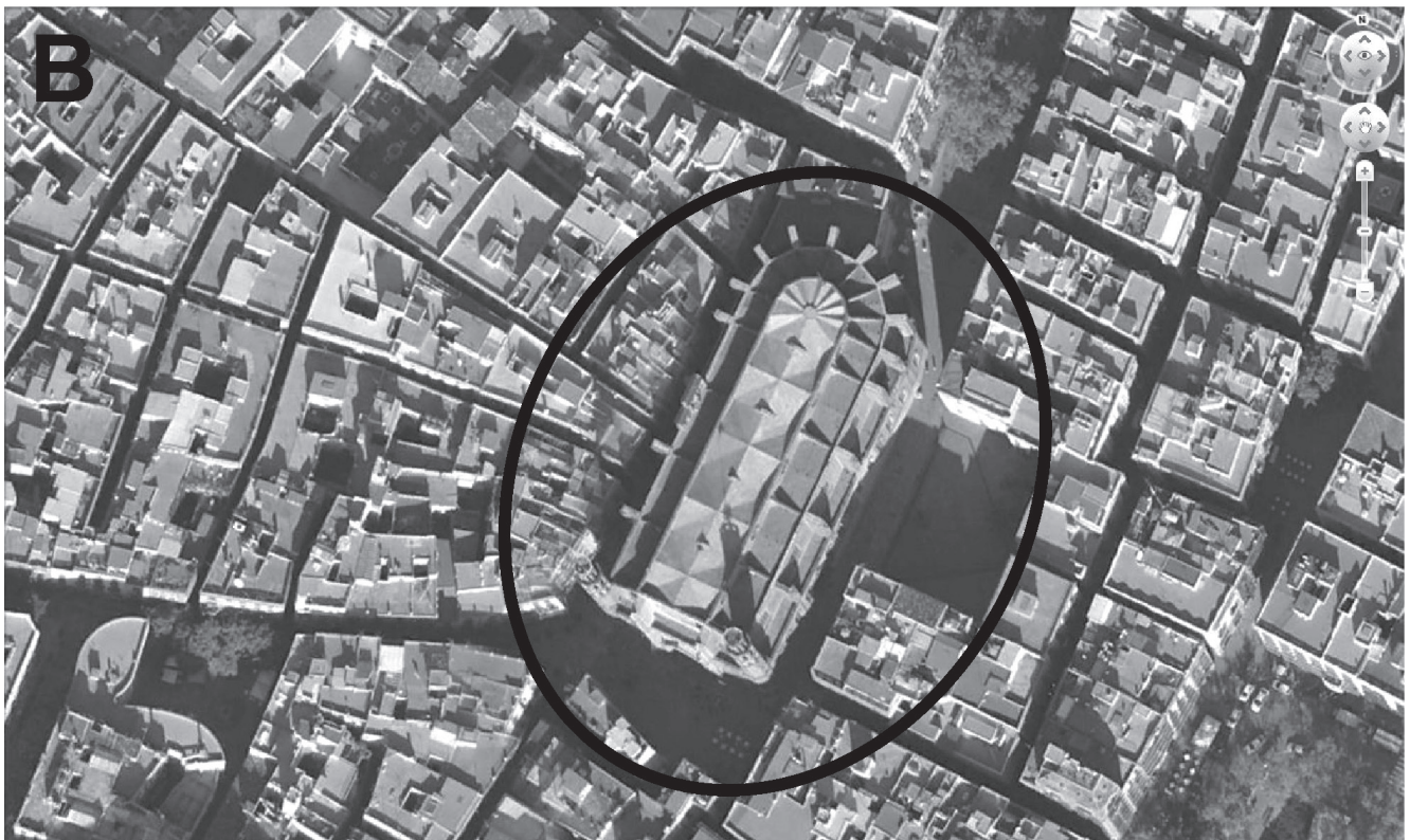
Figura 6. A) Rastros del posible anfiteatro de Barcelona en el urbanismo de la ciudad. En línea continua, las trazas del urbanismo actual; en discontinua, trazas reflejadas en planos del siglo XIX. B) Hipótesis de los límites exteriores del anfiteatro a partir de las trazas urbanas.