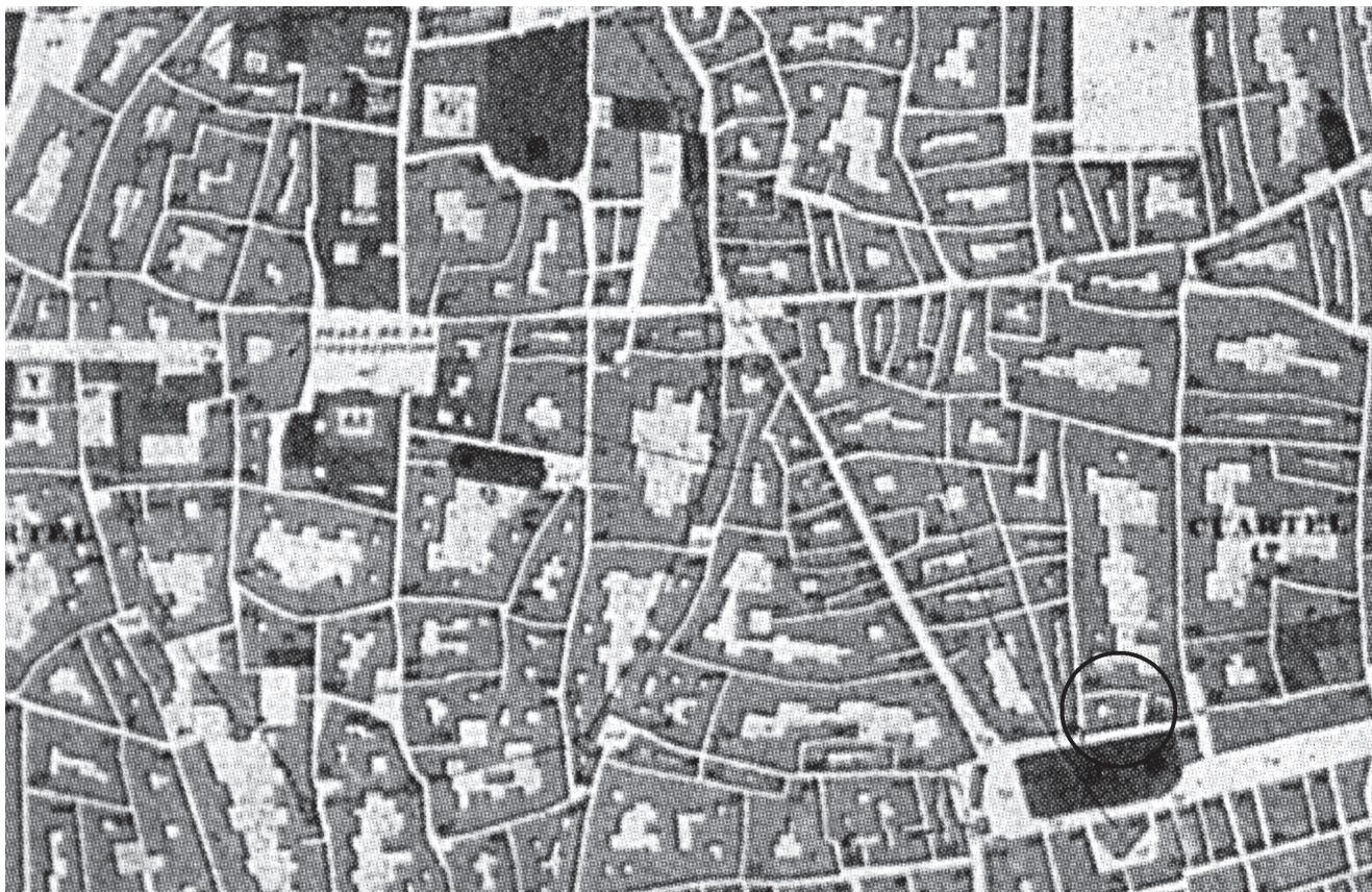
Figura 5. Detalle del plano de Barcelona del año 1842 dibujado por Josep Mas i Vila. En el ángulo inferior derecho se observa la antigua forma ligeramente curva de la calle Sant Antoni dels Sombrierers. Esta traza estaría señalando un fragmento del límite exterior del anfiteatro.

comprobable, como se ha comentado anteriormente, y que curiosamente los planos actuales no recogen. Cabe destacar también de este plano la curvatura que parece coger la calle Sant Antoni dels Sombrierers (fig. 5), curva cuya desaparición se puede atribuir a la remodelación moderna —posterior al plano— de los edificios que conforman esta calle. Por otro lado, en los planos de 1858 de Ramon Alabern y en el de 1862 de Francisco Coello y Maurici Sala se señala otra curva conformada por la línea de fachada de las casas de la calle Sombrierers antes de llegar a la calle Argenteria, curva que actualmente dibuja una anomalía con forma ligeramente angulosa en el trazado recto del resto de fachadas de la calle.