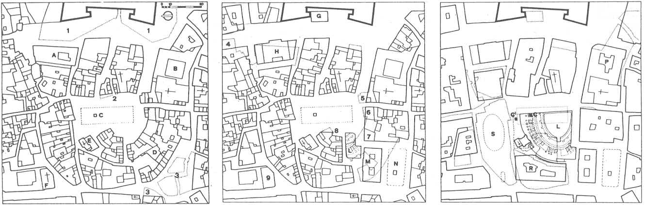
Figura 2. Plaza de S. Oronzio, en Lecce (según Fagiolo-Cazzato, en Cazzato 2000: 43). Su actual trama urbana, con claros indicios de radialidad, delataba la presencia de un anfiteatro.