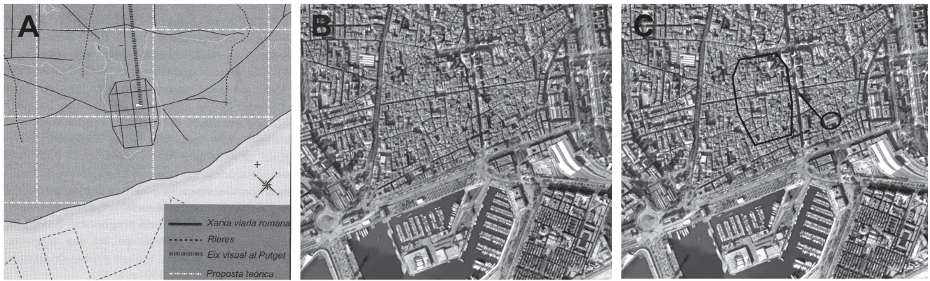
Figura 8. Situación del anfiteatro de Barcelona respecto a la ciudad y su centuriación: A) Detalle de la centuriación de la ciudad y red viaria (según Palet, Fiz, Orenge 2009: 119); B) Vista aérea de la zona de la ciudad romana; C) Vista aérea con indicación de la ciudad romana, la vía romana identificada en la centuriación propuesta por Palet, Fiz y Orenge (calle Argenteria), e hipótesis de ubicación del anfiteatro.

retícula teórica 36 y, lo que es más importante, esta organización o centuriación se ha fechado en la época fundacional de la colonia: por ello si el trazo de la actual calle Argenteria es augusteo, el planteamiento de un anfiteatro en el lugar también.