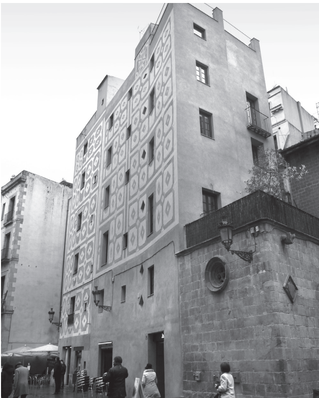
Figura 4. Edificio de la plaza Santa María, n. 7. Nótese la anómala curvatura de la fachada.