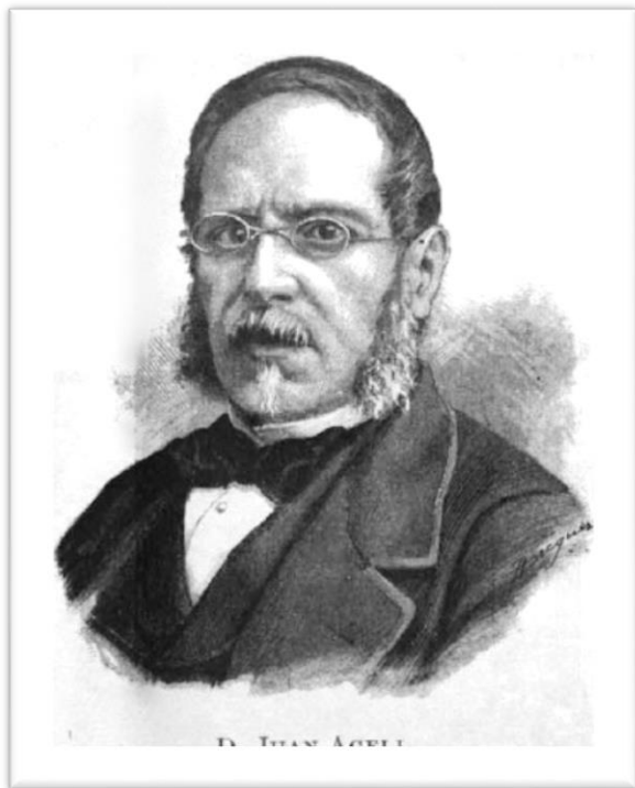
Rector de la Universitat de Barcelona 1864–1865