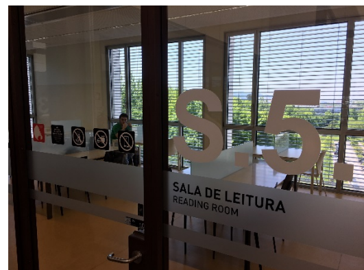
Sala de lectura a la Biblioteca General del Campus Azurém (Guimarães)