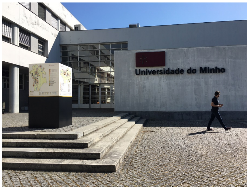
Universidade do Minho. Campus Azurém (Guimarães)