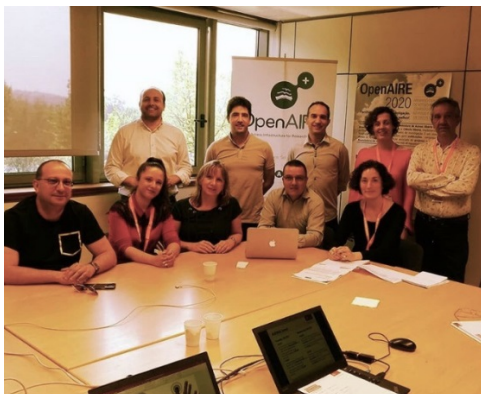
Participants de la INTERNATIONAL Week amb personal dels Serviços de Documentação de la Universidade do Minho (SDUM)

Tota la informació sobre els serveis i projectes del SDUM es poden consultar a: www.sdum.uminho.pt/