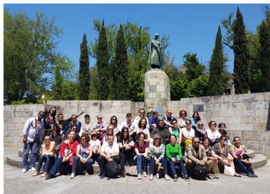
Visita a la ciutat de Guimarães durant la UMinho INTERNATIONAL Week

A l'edició d'aquest any 2018, que s'ha dut a terme entre el 7 i l'11 de maig, hem participat personal d'institucions d'arreu del món. En total, 36 persones de diferents serveis (suport a la docència, serveis acadèmics, biblioteca, oficines de mobilitat internacional, servei de comunicació i premsa, etc.) i països (Itàlia, Polònia, Marroc, Estats Units, Algèria, Armènia, Jordània, Japó, Indonèsia, entre d'altres) hem compartit sessions de treball conjuntes i altres separades per tipus de serveis, així com activitats culturals per conèixer les ciutats de Braga i Guimarães.