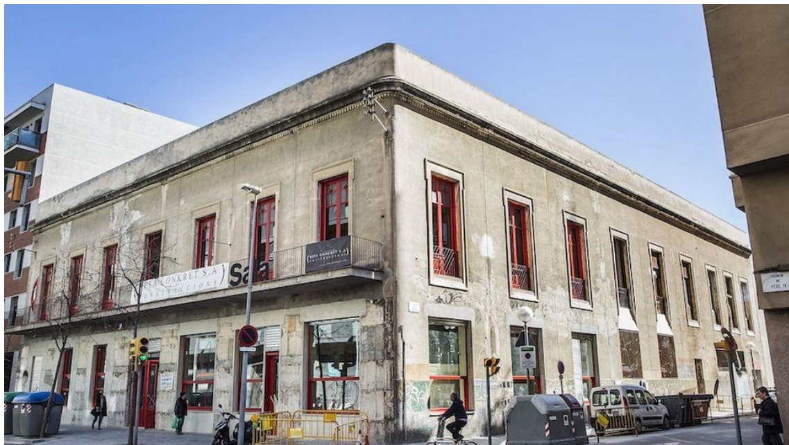
Imatge de l'edifici adquirit per Pau i Justícia el 1910. Realitzada el mes de març del 2016, abans de convertir-se en la nova sala Beckett de Barcelona. Extreta de: < http://www.ara.cat/cultura/Aixi-sera-nova-Sala-Beckett_0_1532846752.html >.

IV i la carretera antiga de València. La junta directiva obtenia autorització de l'assemblea per tirar endavant l'operació, que va consistir en la compra perpètua del terreny edificable, que constava d'un total de 348 metres quadrats. El preu ascendia a 18420 pessetes, de les quals 10000 s'havien d'entregar en el moment i, la resta, en tres terminis anuals. Immediatament després de l'adquisició dels terrenys es van iniciar les obres de construcció de l'edifici, una operació que va requerir que, de forma excepcional, s'augmentés del 12 al 25% l'atribució al fons de reserva. Finalment, el 21 d'octubre de 1910 la junta directiva comunicava a l'assemblea el trasllat de la societat al nou local, situat al carrer Pere IV número 228-232, direcció en la qual la cooperativa fixava la residència.