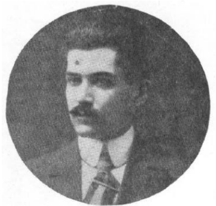
Fotografia de Rafael Guerra del Río. Extreta de: < http://diputatsmancomunitat.cat/mancomunitat/content/ guerra-del-r%C3%ADo-rafael >.

alliberat gràcies a la campanya engegada per la Mancomunitat. Després d'aquest episodi va abandonar Barcelona. 62