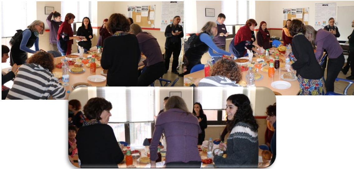
II-Il·lustració 8: Celebració del dinar comunitari

Ens sembla que una manera de seguir avançant en la transversalitat en primer curs del Grau de Treball Social pot ser definir un problema o pregunta (el que hem treballat fins ara ha estat la immigració), treballar des de les diferents assignatures del segon semestre de primer curs en les aportacions que es poden fer des de cadascuna d'elles per comprendre/resoldre aquest problema o pregunta.