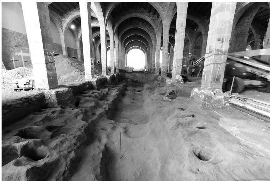
FIGURA 3. Vista de la grada de construcció de galeres que va sortir durant l'excavació arqueològica, una estructura amb un pendent de 3° cap a mar, una amplada de 8 metres, una profunditat màxima de 1,70 m i una llargada d'uns 40 m. Tot al voltant es poden apreciar els forats dels puntals per a la construcció. La seqüència estratigràfica data l'ús de la grada al segle XVII.

les excavacions arqueològiques i la discussió de les hipòtesis dels arqueòlegs sobre el terreny van permetre encaixar ambdues realitats amb una explicació coherent: la major part de l'edifici que conservem actualment no es correspon amb la drassana medieval original (de la qual es conserva una part relativament petita), sinó que es tracta d'un conjunt construït al segle XVI, en una cronologia encara per especificar. 15