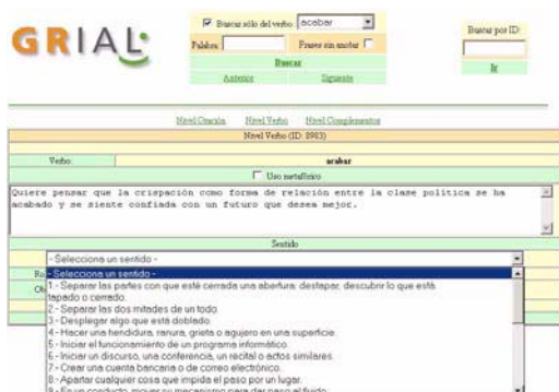
Figura 1: Anotación del sentido verbal

El inventario de sentidos, como se ha mencionado, es anterior al proceso de anotación, pero es modificado siempre que los ejemplos encontrados en el corpus demuestren la existencia de un sentido no contemplado, o bien, cuando los ejemplos son difíciles de clasificar porque se da confusión entre sentidos, lo que provoca que algunos de ellos acaben fusionándose. Además, si en alguna frase el sentido verbal se utiliza metafóricamente y este uso no se considera suficientemente habitual como para crear un nuevo sentido, se marca como uso metafórico del sentido inicial.