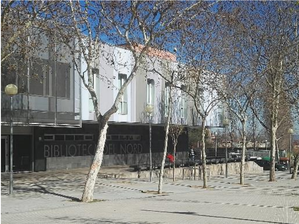
Figura 7. Edifici de la Biblioteca del Nord de Sabadell