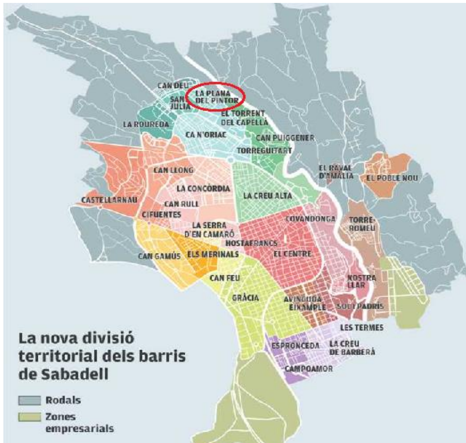
Figura 6. Mapa dels barris de Sabadell amb indicació del barri on es troba la Biblioteca Sabadell Nord

i Sector Sant Julià. La biblioteca Sabadell Nord s'ubica al Sector Nord, i més concretament al barri de la Plana del Pintor 31 .