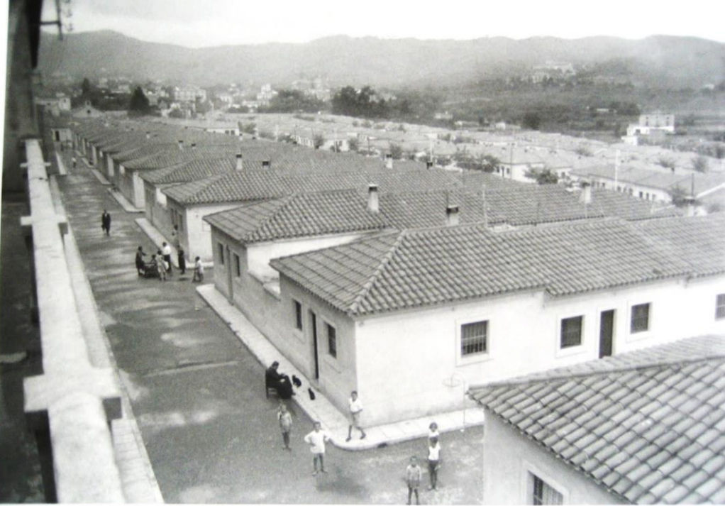
Figura 4: Imatge de las Casas Baratas del Bon Pastor als anys 60.

L'any 1929 el Instituto Municipal de la Vivienda va seleccionar 11 hectàrees de terreny properes a les fàbriques per a la construcció d'un grup de cases barates oficialment conegudes com les cases del grup de Milans Bosch.