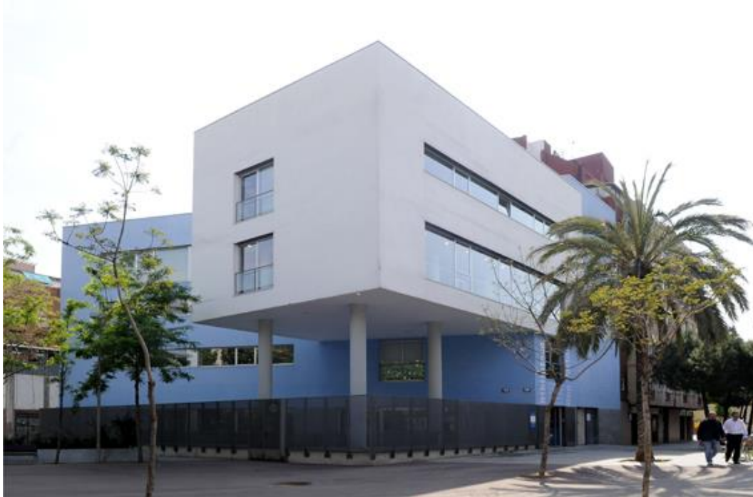
Figura 5: Edifici de la Biblioteca del Bon Pastor

i més concretament és la responsable de cobrir el servei a la zona de Bon Pastor i Baró de Viver.