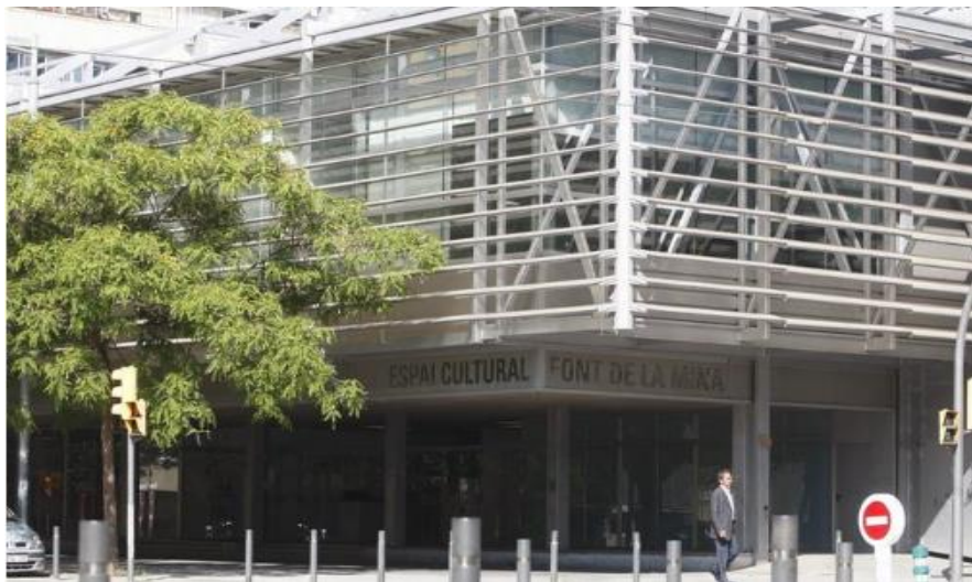
Figura 2. Edifici de la Biblioteca Font de la Mina

Els usuaris potencials als que la biblioteca dirigeix el seu servei són els que s'ubiquen als barris de la Mina, la Catalana, el Besòs i Fòrum. Segons les dades obtingudes l'any 2016 la biblioteca presta servei a 16.807 habitants. S'espera que aquest àmbit d'actuació experimenti en breu un considerable creixement per la transformació que actualment s'està desenvolupant a la zona de la Catalana 16 .