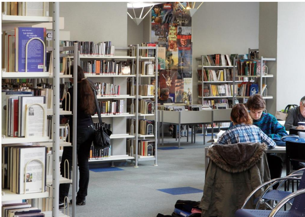
Figura 9. Imatge interior de la Médiathèque Centrale de Perpignan

La Médiathèque és un dels quatre equipaments que forma part de la xarxa de biblioteques de Perpinyà. La designació de Mediateca s'explica pel fet que, a més tenir tots els serveis tradicionals de biblioteca, també compta amb un important fons audiovisual i amb uns amplis serveis en línia. Tal i com indica a la seva web 43 , la seva missió és afavorir l'accés al públic a la lectura, la imatge, el so i les tecnologies de la Informació i la Comunicació.