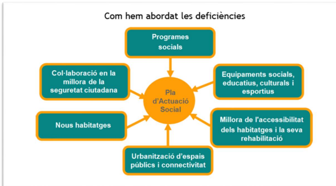
Figura 1. Esquema de les àrees d'actuació del Pla de Transformació de la Mina

a final de la dècada dels 90, quan es va elaborar el Pla de Transformació del barri de la Mina. El pla va entrar en vigor l'any 2000 amb la creació del Consorci del barri de la Mina.