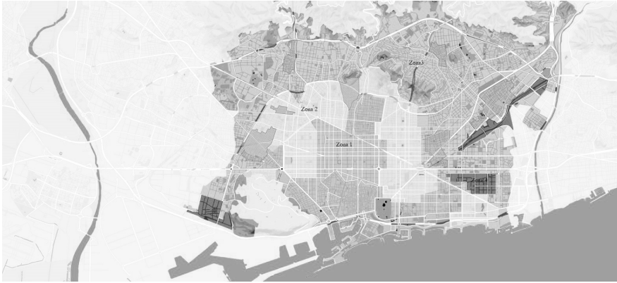
FIGURA 2 | Zonas de alojamiento turístico en las que queda dividida Barcelona tras la aprobación del Plan Especial Urbanístico de Alojamientos Turísticos (PEUAT)