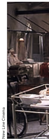
New Line Cinema

Ernest Hemingway l'any 1918 durant la Primera Guerra Mundial a Milà (Itàlia).