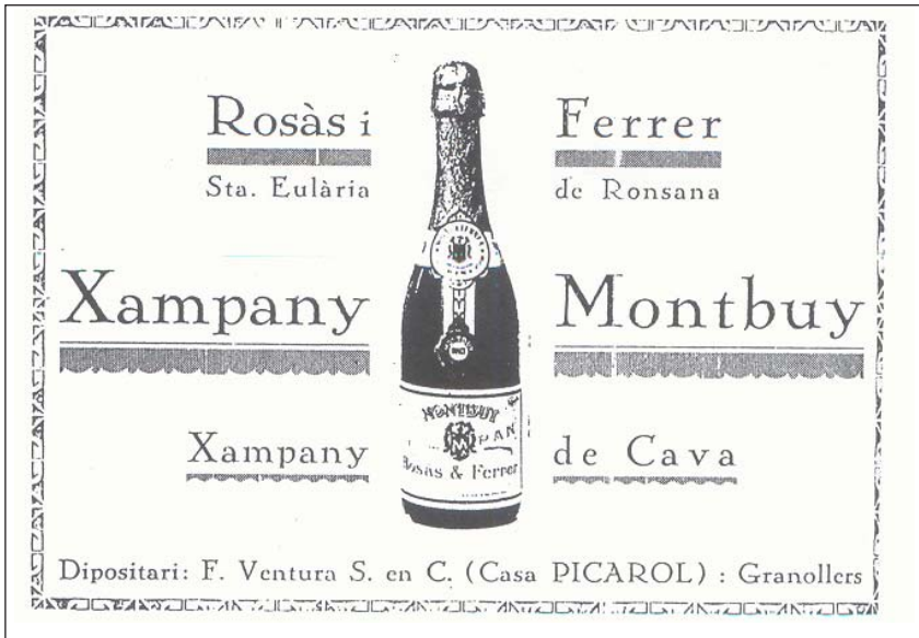
L'anunci Xampany Montbuy

Xampany Montbuy de Santa Eulària de Ronçana es començà a comercialitzar en els anys vint i va tenir una distribució remarcable fins a la Guerra Civil.