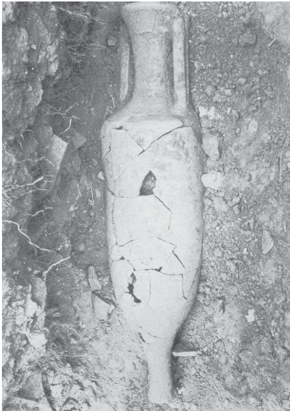
Àmfora vinària laietana, procedent de can Collet (Llinars del Vallès), un dels centres productors d'àmfors més representatius de la comarca. Datada entre el segle I d.C. i principis del segle II d. C., va ser restaurada pel ceramista Antoni Cumella i Serret (Fotografia: Lauro. Revista del Museu de Granollers , núm. 1, 1990, pàg. 47)

Així s'explica, per exemple, la presència de la vinya al Vallès durant l'antiguitat romana. Les àmfors procedents del Vallès descobertes a Roma acrediten que en aquest període històric el vi vallesà ja circulava pel Mediterrani, i les excavacions arqueològiques han pogut identificar centres productors d'àmfors al Vallès que es podrien remuntar a la primera meitat del segle I a. C 3 . Tanmateix, el moment de màxima esplendor de les exportacions vallesanes de vi es situa en el segle I d. C.