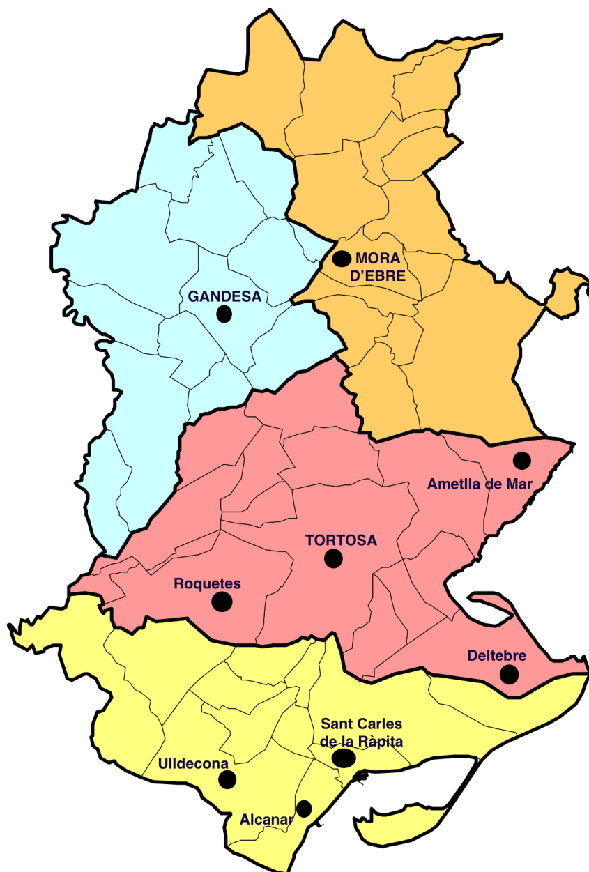
Figura 4. Localització de les biblioteques analitzades.

Com ja s'ha comentat en apartats anteriors, les biblioteques seleccionades per a aquest treball són les dels municipis amb més de 5.000 habitants i les biblioteques comarcals.