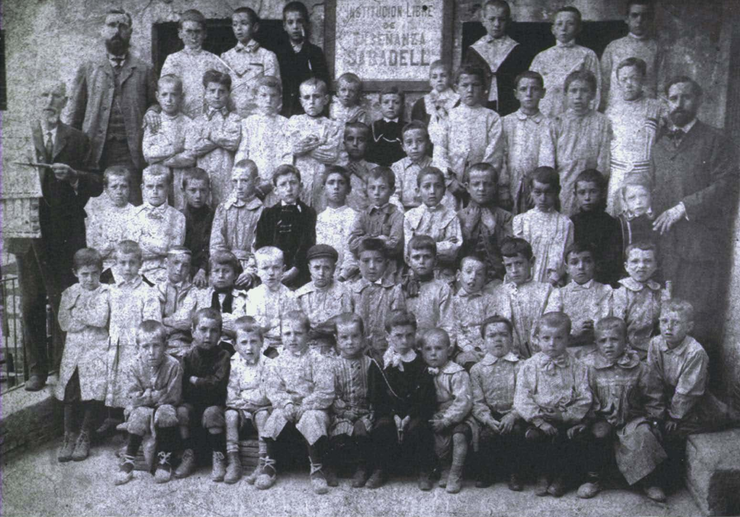
Fotografia 1. Alumnes de la Institución Libre de Enseñanza, ca. 1910.