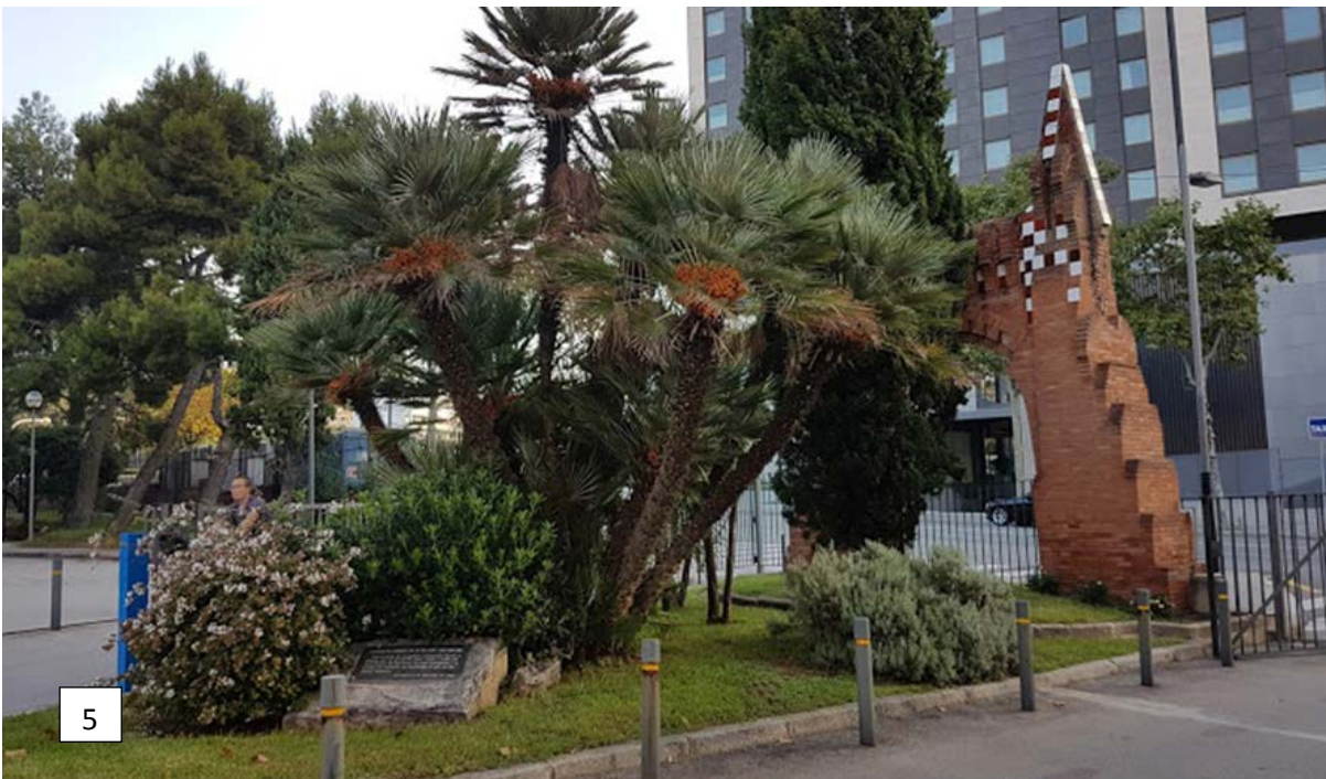
1.- Paisatge de finca Güell abans de d'edificació amb una porta perimetral (ca. 1880); 2 i 3.- Edifici de la Facultat de Farmàcia (1958); 4.- Placa commemorativa del centenari del Dr. Pius Font i Quer al jardí de la Facultat (1988); 5.- Imatge actual de l'entrada de la Facultat (2019).