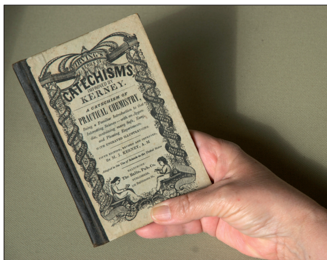
FIGURA 2. Catechism of practical chemistry , de Kerney (1854), que mostra les dimensions reduïdes característiques dels catecismes bàsics.

Molt. En unes dècades es van publicar nombroses obres d'aquest estil, escrites per Joyce [7], Pinnock [8], Roberts [9], Graham [10], Irving [11], Johnston [12], Kerney [13] (de fet, es tracta d'una edició revisada del catecisme d'Irving, figura 2), Haines [14] i Neat [15].