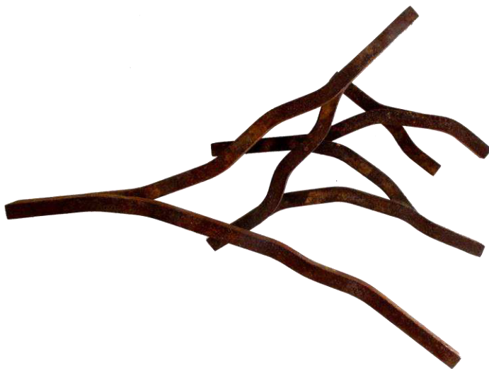
Imatge 1. Miquel Planas. L'O-43 , 2017. Acer soldat i oxidat, 5x24x19 cm.