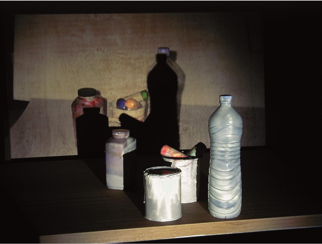
Imatge. 3. Joan Descarga. De llums i ombres, 2000. Objectes diversos i llum i ombres.