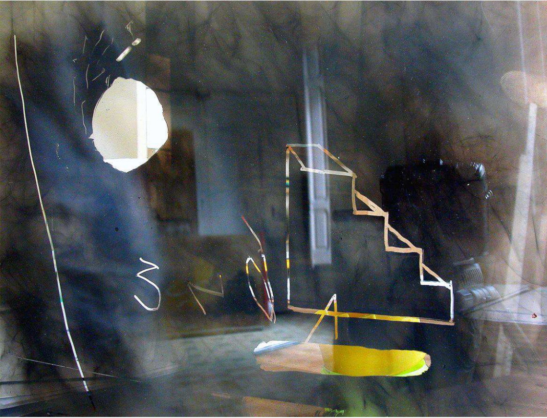
Imatge 4. Joan Descarga, 2001. Narratives de fum. Fum sobre metacrilat. 23,5 x 32 x 0,5 cm