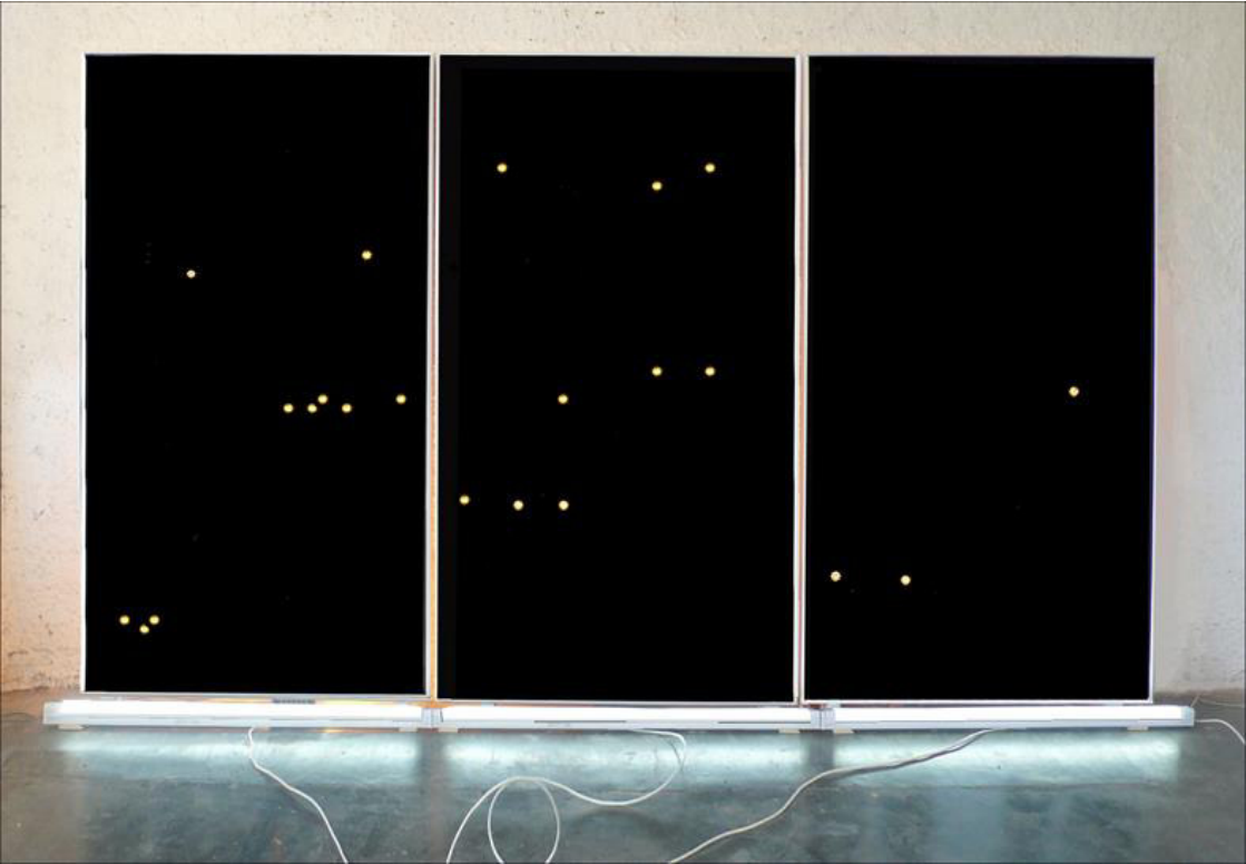
Imatge 2. Àlex Nogué. Triptic de l'espai votiu, 2014. Instal·lació, Pintura acrílica sobre fusta, 3 barres fluorescentes de 122 cm de llarg de 36 W-230 V 3 focus de 100 w-230 w, 196,5 cm x 348 cm x 2.000 cm variables.