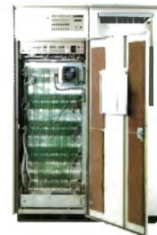
Primer ordenador de Banco Sabadell

Para cualquier consulta o ampliación de información, puedes contactar con el personal técnico del AHBS mediante la dirección electrónica: ArchivoHistorico@bancsabaddell.com .