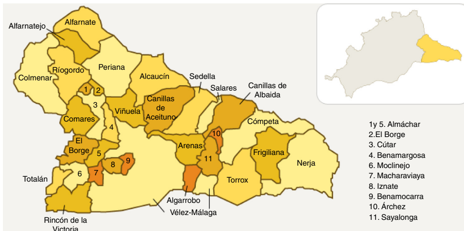
Figura 1. La Axarquía.