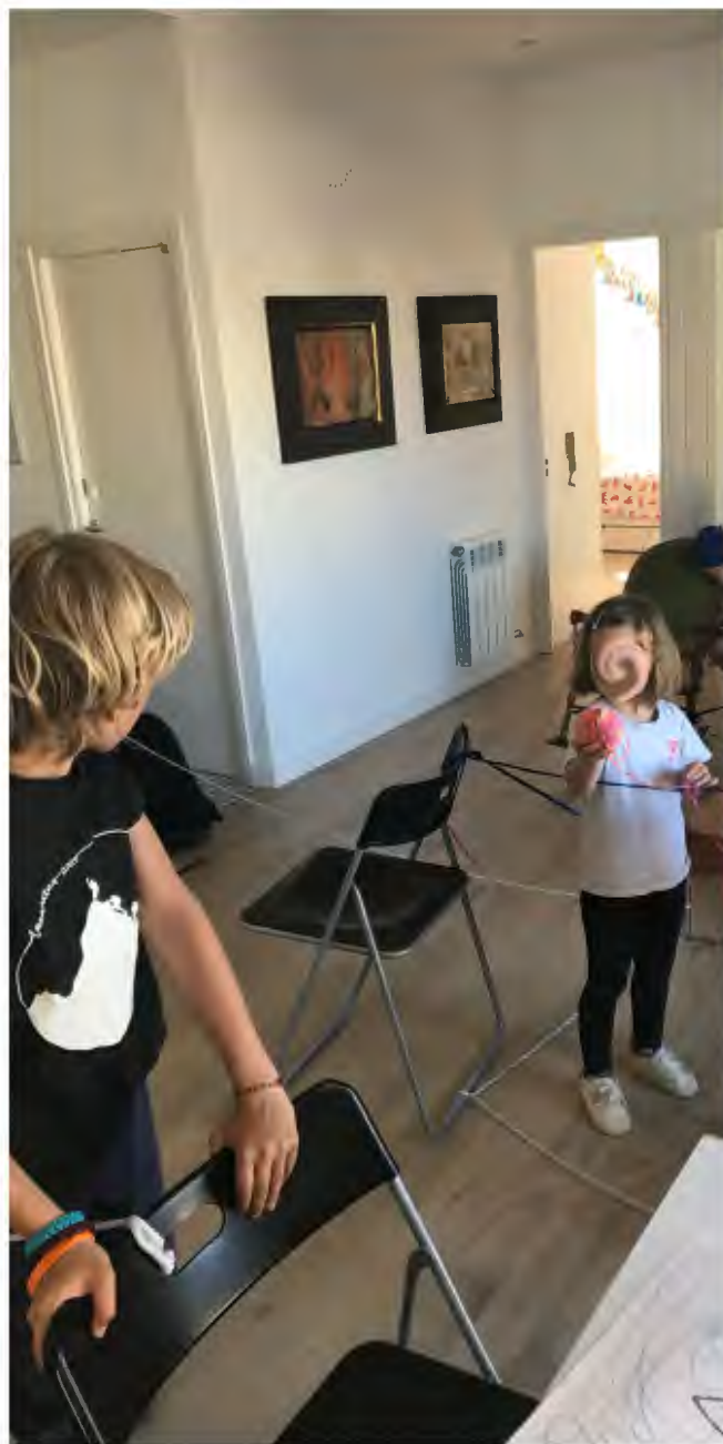
«Teixint nous recorreguts a casa», 2018. Pràctica artística en clau educativa.