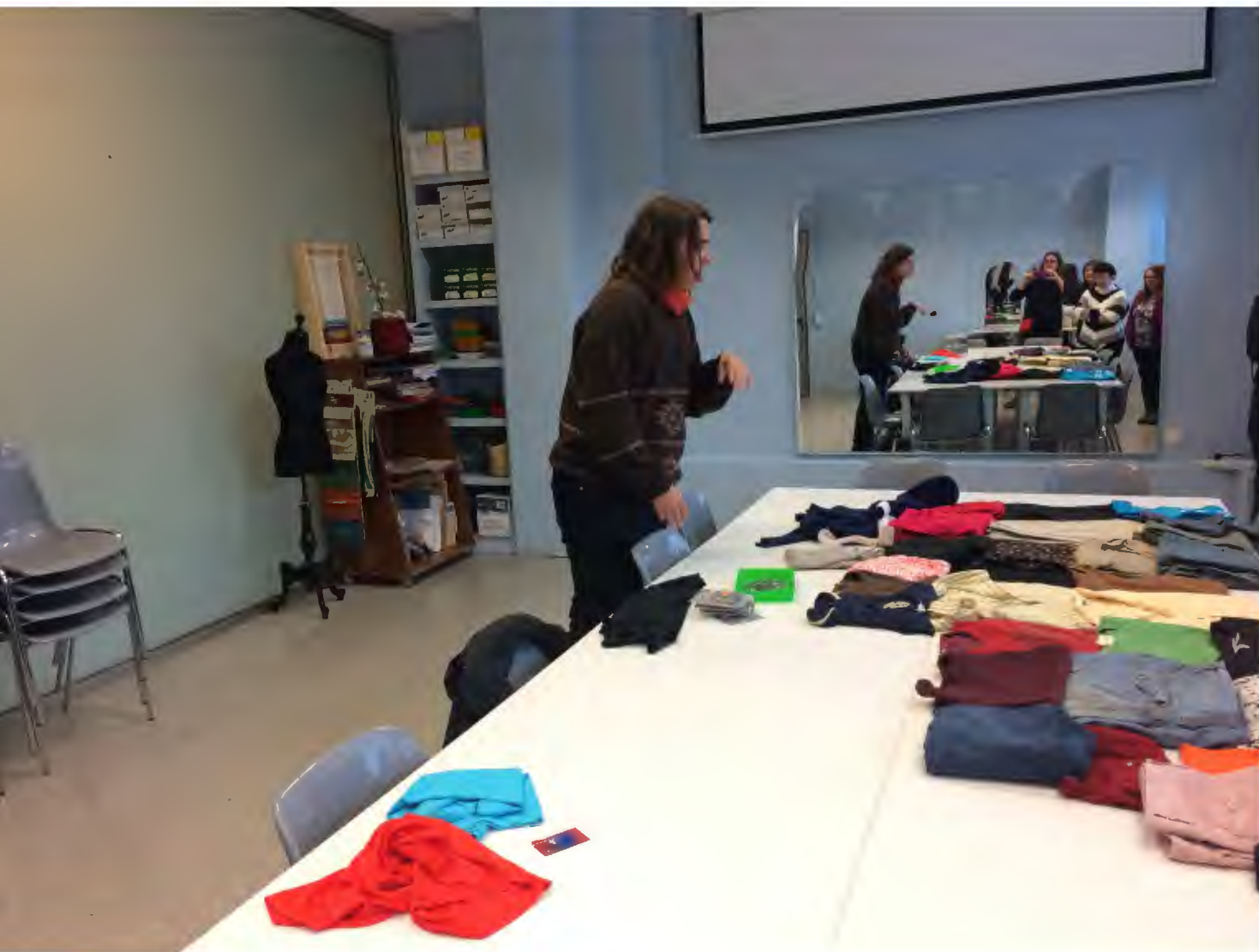
Projecte d'Aprenentatge Servei, «Genealogies. Identitats tèxtils» 2018 Centre de Documentació i Museu Tèxtil de Terrassa