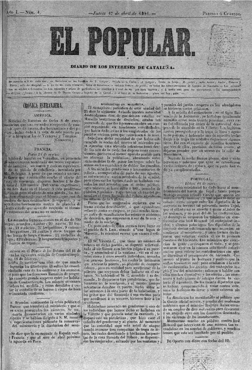
Primer número de El Popular , de l'1 d'abril de 1841. AHCB D1851.

setembre de 1842. 22 Pere Mata va arribar a la redacció del diari en tornar de l'exili després que hagués de fugir durant la dictadura del capità general de Catalunya,