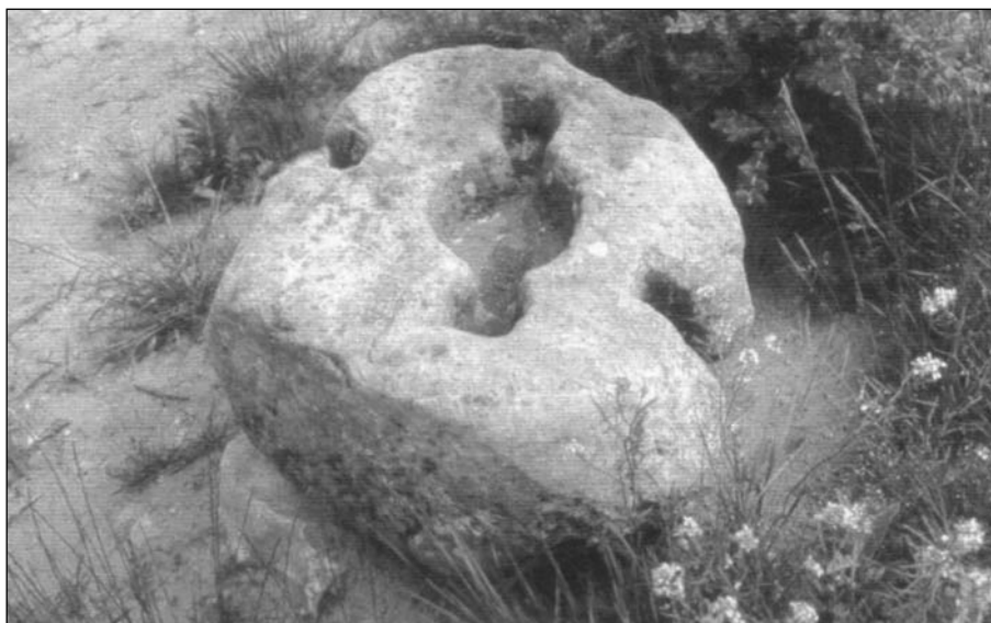
Figura 3. Contrapès de pedra cilíndric amb perforació central, procedeix del poblat de Vilaclara, Castellfollit del Boix, i va ser emprat en una premsa de cargol per produir vi. Segons R. NAVARRO (2005). «L'antiguitat tardana. La documentació arqueològica». Dins: J. GUITART i DURAN (coord. Vol. 1). Història Agrària dels Països Catalans . Barcelona: Fundació Catalana per a la Recerca i la Innovació, Universitats dels Països Catalans, p. 540.

artesanals, les més recognoscibles, per ara, les metal·lúrgiques (a la Solana, al Morè —Sant Pol de Mar, Maresme—) i, en menys grau, les ceràmiques (a la Solana), ajuden a confirmar la continuïtat en el temps d'aquests tipus d'assentaments.