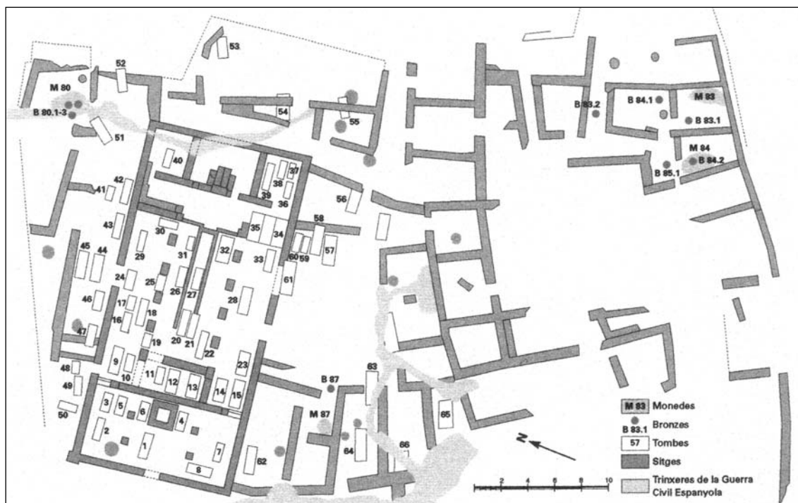
Figura 1. Planta del poblat i de la basílica del Bovalar, Seròs, inici del s. VIII. Segons P. de PALOL (2005). «L'antiguitat tardana, economia i societat del Baix Imperi i l'època visigoda». Dins: J. GUITART i DURAN (coord. Vol. i). Història Agrària dels Països Catalans . Barcelona: Fundació Catalana per a la Recerca i la Innovació, Universitat dels Països Catalans, p. 503.

fins i tot es pot determinar un possible augment de la producció. El mateix podríem dir de la vil·la de Vilauba (Camós, Pla de l'Estany), on hi ha una última fase de transformació de les seves estructures productives que es pot situar entre els segles VI i VII.