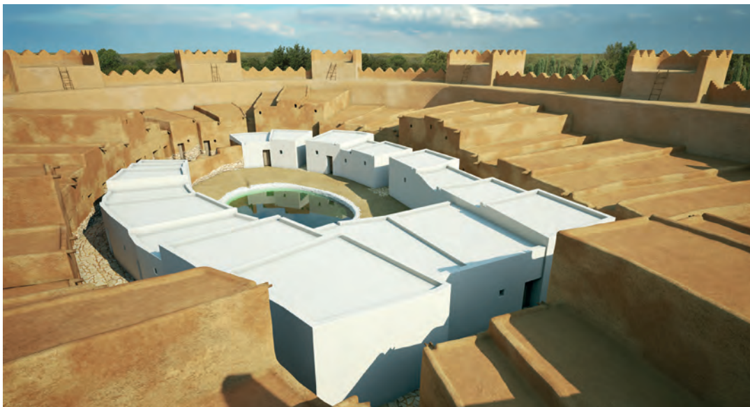
Figura 5. Els Vilars fase I, panoràmica interior de l'urbanisme i la muralla.