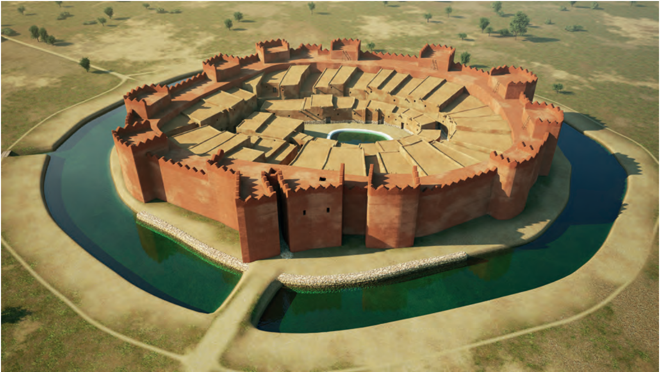
Figura 8. Els Vilars fase II, panoràmica general.