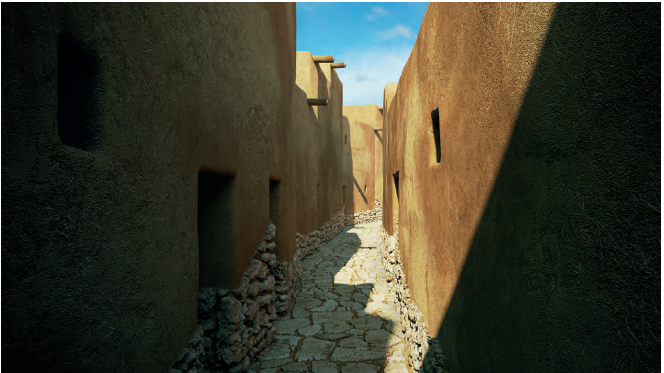
Figura 9. Els Vilars fase II, carrer.

la Ciutadella Ibèrica de Calafell. Els criteris emprats als Vilars recorden les idees del crític d'art John Ruskin (1819-1900) exposades en la seva gran obra The Seven Lamps of Architecture (1849), en la qual planteja que les restes arquitectòniques o els edificis són com una persona gran, a la qual no cal intentar rejuvenir amb cremes ni pintures. En tot cas, cal fer tot el que es pugui per conservar els seus membres,