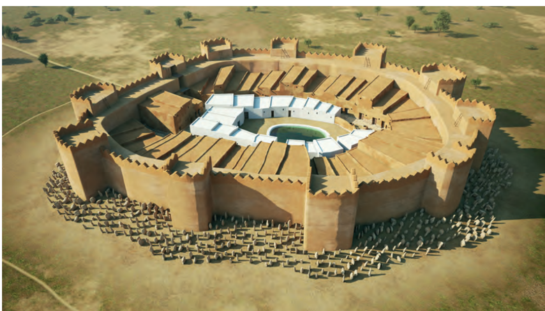
Figura 6. Els Vilars fase I, panoràmica general.