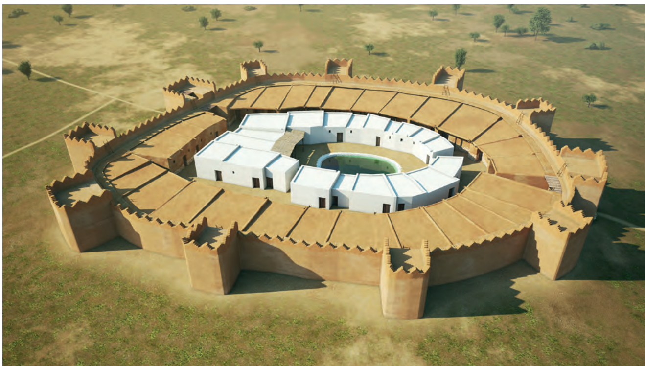
Figura 3. Els Vilars fase inicial, panoràmica general.

Si ens fixem detalladament en les fases evolutives de la fortalesa, que és el que ara ens interessa, en la seva etapa inicial, que els arqueòlegs diuen Vilars 0, es mostra una estructura urbana fortificada amb dues portes d'entrada; està situada al centre d'una plana, i en el seu interior les cases, de planta rectangular o trapezoidal, estan adossades a la muralla perimetral, amb un pas de ronda que permet accedir a les torres, quadrangulars i massisses per l'interior (figura 3). Un carrer concèntric, a manera d'anell interior, permet accedir a tots els habitatges mitjançant una porta que s'obre al mateix carrer. La zona central del jaciment, en gran part destruïda, no resulta fàcil de reconstruir, i la hipòtesi dibuixada és simplement la més probable (figura 4). El pou central es troba al centre del conjunt. La imatge de l'interior del jaciment, obtinguda després de l'anàlisi de l'excavació arqueològica, mostra les cases o habitacles, dotats d'un petit atri, amb una estructura de fusta a manera de suport al voladís. Finalment es pot proporcionar també una vista hipotètica del pou central, descobert, amb les aigües que reflecteixen les cases que l'envolten. La textura