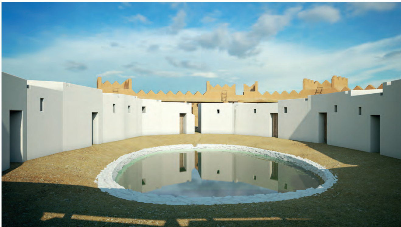
Figura 4. Pou central a la fase inicial.

en blanc indica, com sempre, la manca d'evidències arqueològiques d'una part d'aquesta recreació virtual. Les imatges exteriors mostren la muralla, sense cap altra defensa perifèrica encara, dotada d'un sistema de merlets; la tipologia recorda les construccions similars de la Mediterrània oriental, singularment les del món fenici o semita. No cal dir que aquesta hipòtesi no es fonamenta en cap evidència. A les vistes exteriors s'emfatitza una de les portes del recinte, amb dues torres bessones a banda i banda, i que està molt ben documentada arqueològicament. Una altra porta ha estat dibuixada en una de les torres de l'altre extrem de l'eix del jaciment.