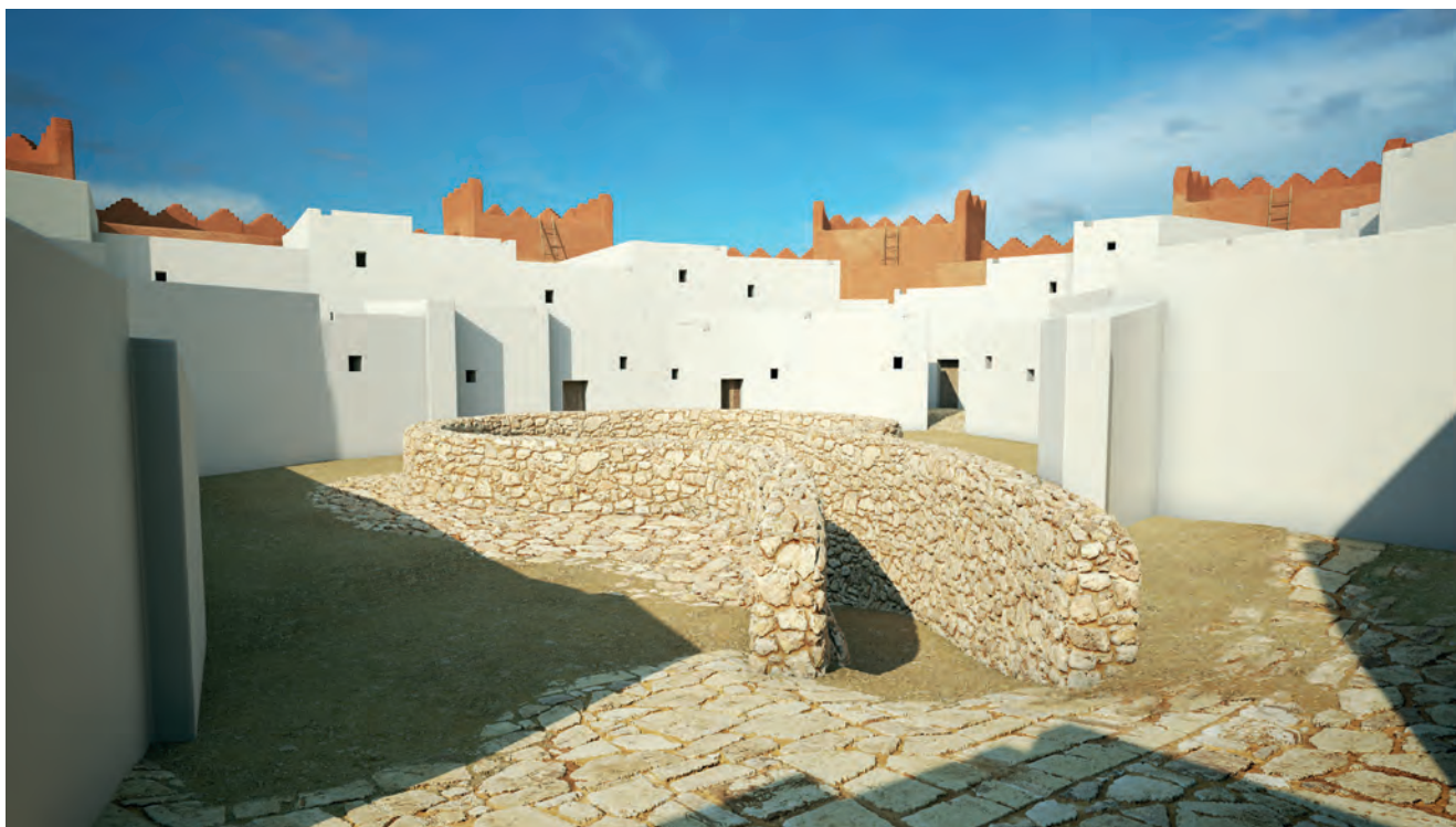
Figura 11. Pou central a la fase III.

ció. Tot el que s'afegeix a unes restes originals ho compara amb "una dona elegant que menysprearia portar joies falses" (Ruskin 1987: 60).