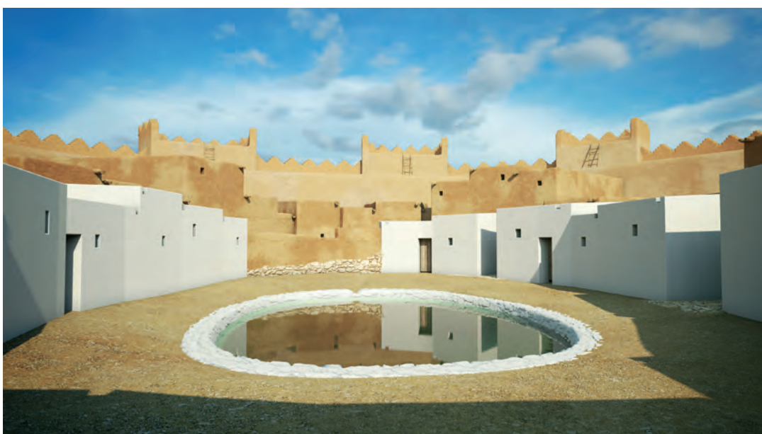
Figura 7. Pou central a la fase I.