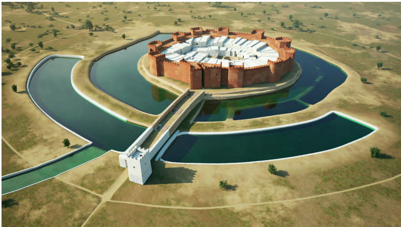
Figura 10. Els Vilars fase III, panoràmica general.