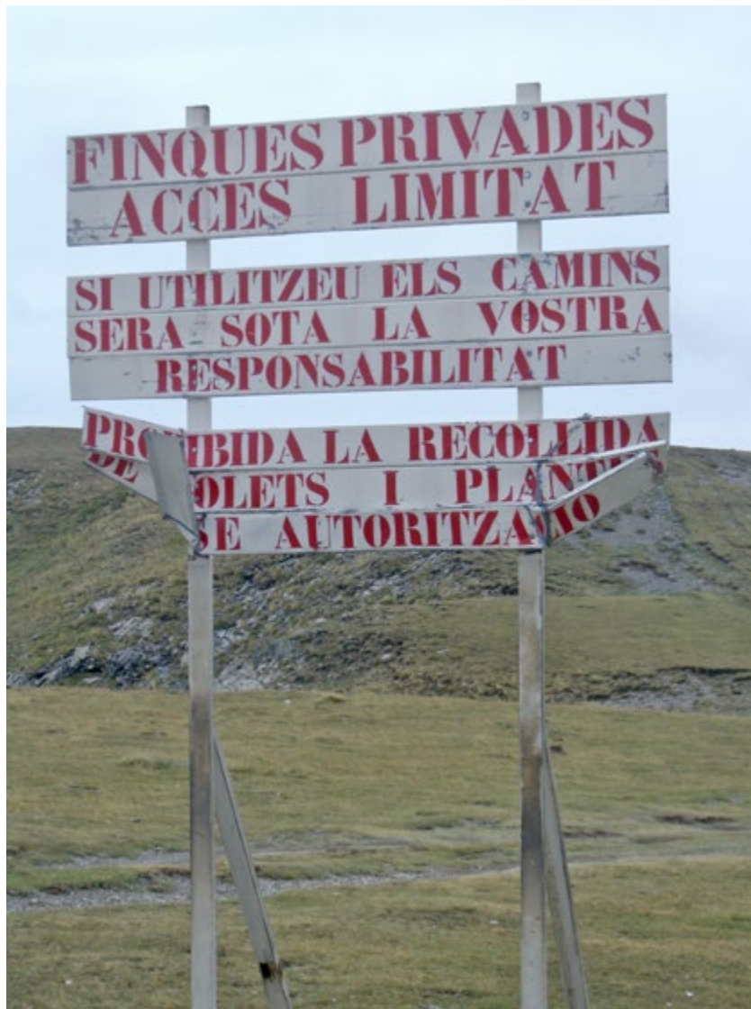
De resultes del procés històric, la titularitat de les forests està associada avui a formes d'ús i gestió molt diverses. Farrera (2010). Oriol Beltran

Com a situació més freqüent, una gran part de les muntanyes de titularitat municipal són avui referides com a “comunals”. L'expressió és, no obstant això, imprecisa i contribueix a un alt nivell de confusió. D'una banda, l'estatut atorgat a aquestes forests en el nou context va afavorir el manteniment dels aprofitaments tradicionals en benefici dels veïns. Sovint, aquests encara van poder gaudir durant dècades d'una autonomia relativa en la gestió dels recursos per a la satisfacció de les seves necessitats (Iriarte, 2002b; Pipió, 2003). L'assignació de la titularitat als municipis, no obstant això, atorgava formalment la capacitat política sobre els recursos locals als ajuntaments. Els comuns de veïns perdien, d'aquesta manera, les seves antigues atribucions al mateix temps que la vinculació del veïnatge a la residència trencava amb el caràcter corporatiu que havien mantingut les comunitats locals fins a finals de l'època moderna (Bringué, 2003).