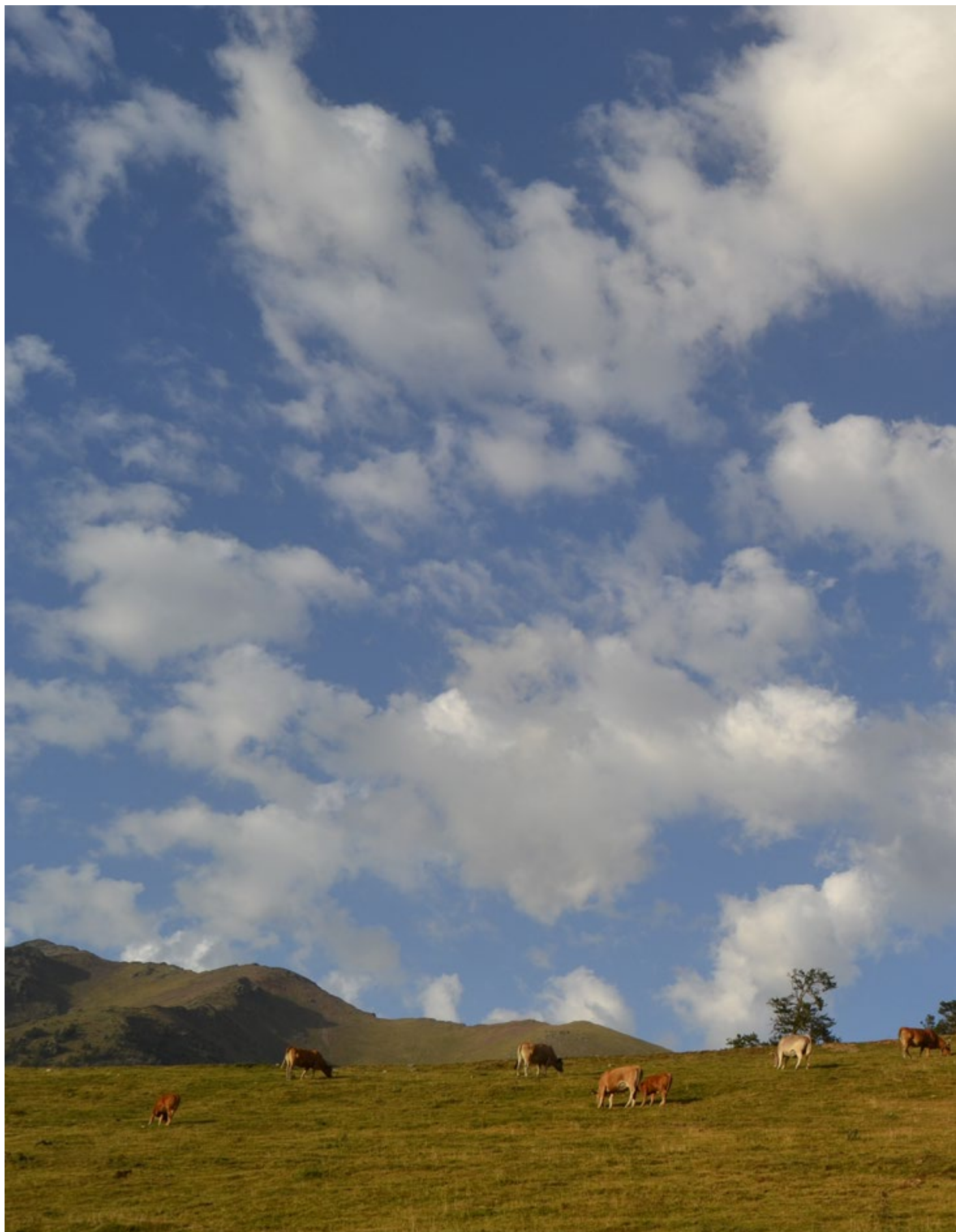
Els aprofitaments pastorals han afavorit la continuïtat de la gestió col·lectiva de la muntanya. Port de Cabús (2012). Oriol Beltran