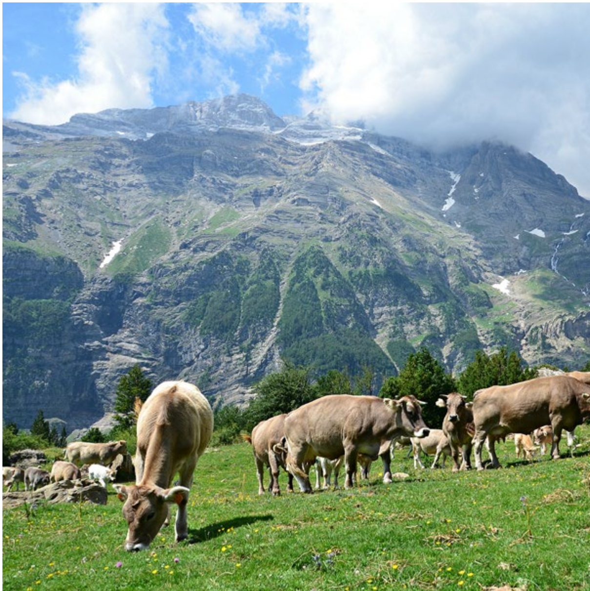
La implantació massiva d'àrees protegides conforma la darrera onada de les polítiques de territorialització a l'alta muntanya. Pastures al Parc Nacional d'Aigüestortes i Estany de Sant Maurici (2010). Oriol Beltran

les comarques de l'Alt Pirineu deriva, per tant, de la potestat que s'atribueix l'Estat sobre uns béns que durant segles havien estat propis de les comunitats locals. Reflecteix, en definitiva, la importància històrica de la propietat comunal a les muntanyes d'aquesta regió.