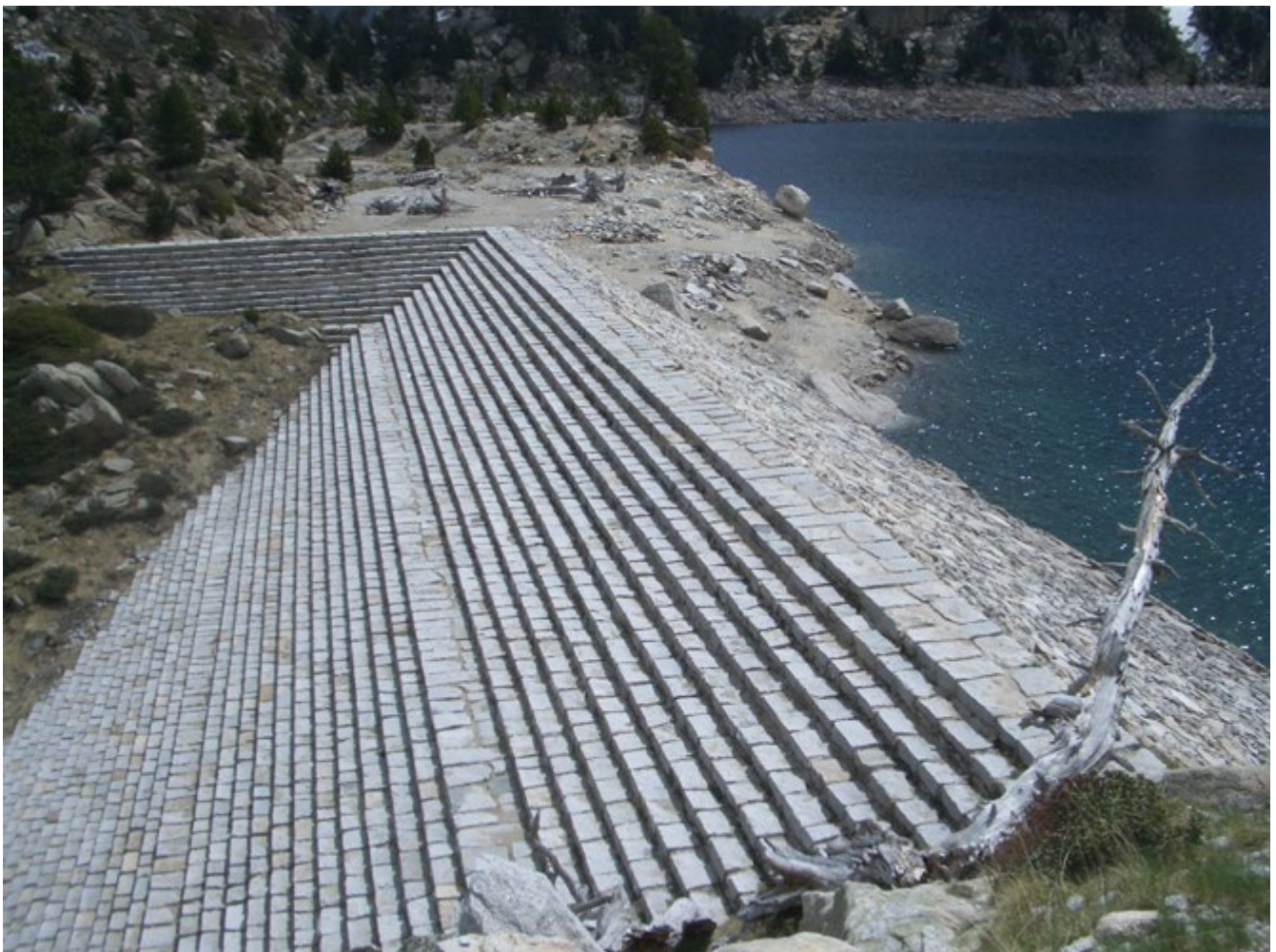
La promoció turística de l'alta muntanya naturalitza un paisatge profundament humanitzat. Estany Negre de Peguera (2006). Oriol Beltran

La socialització de la muntanya no s'ha limitat, però, a les seves dimensions formals i materials. Les activitats productives desenvolupades històricament per les comunitats humanes, per mitjà de les quals aquestes es beneficiaven del territori i els seus recursos, es basaven en sistemes de drets i deures que ordenaven la vida social. La importància de què havien gaudit les formes col·lectives d'apropiació i gestió dels recursos en el passat s'ha d'entendre en aquest context. Així, a diferència d'altres regions on els sistemes de propietat garantien i reforçaven una independència relativa dels grups domèstics, el pes tradicional de la propietat comunal a les societats muntanyenques ha d'interpretar-se com a un mecanisme afavoridor de la interdependència i la cooperació entre les famílies.