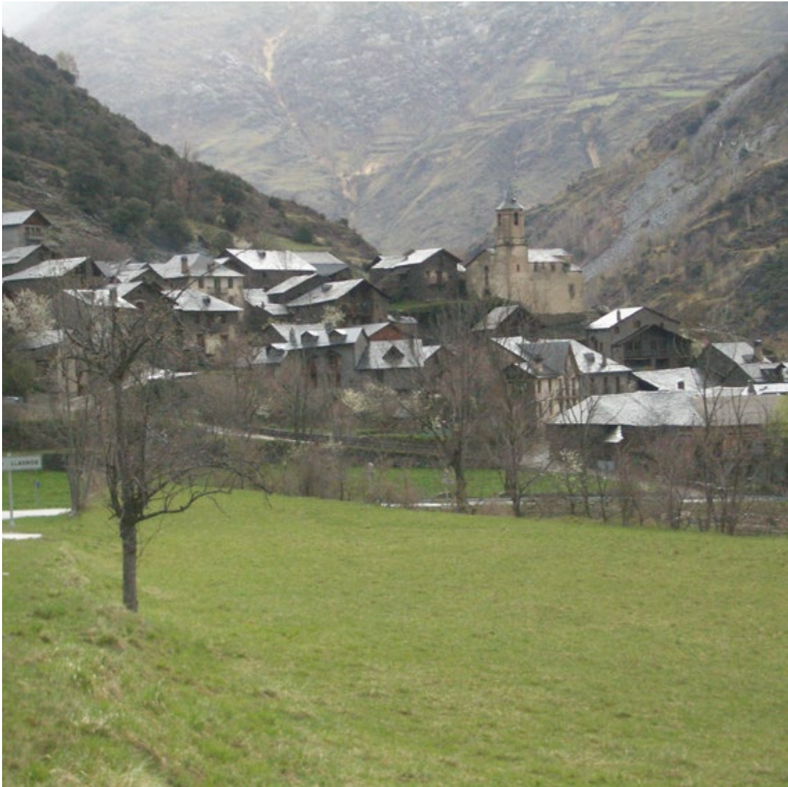
A l'Alt Pirineu, els pobles no han estat històricament mers agregats residencials sinó instàncies importants a escala social i econòmica. Lladrés (2010). Oriol Beltran

família? ¿Per què els espais que no van permetre en el passat la pràctica de l'agricultura, aquells on s'estenen els boscos i els prats, pertanyien de manera col·lectiva als veïns dels pobles, no han estat privatitzats i són qualificats encara avui com a comunals? Els arguments de caràcter funcional s'identifiquen aquí com els més plausibles. Així, mentre que en el primer cas els grups domèstics (les cases) estaven en principi facultats per dur a terme l'aprofitament intensiu que implicava l'agricultura, l'apropiació col·lectiva de les muntanyes permetia recolzar la gestió en comú d'uns recursos que eren explotats de forma extensiva.