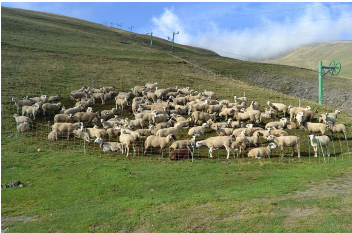
Els aprofitaments turístics pirinencs s'han implantat als antics comunals. Ovelles a l'estació d'esquí de Llessui (2014). Oriol Beltran

d'aprofitament veïnal. De fet, una bona part dels nous aprofitaments (com ara les estacions d'esquí o les àrees protegides) s'estenen pels antics comunals. El Pallars Sobirà, on aquest protagonisme s'ha traduït en dues línies d'actuació diferents, proporciona també aquí un bon cas d'estudi per mostrar aquest procés.