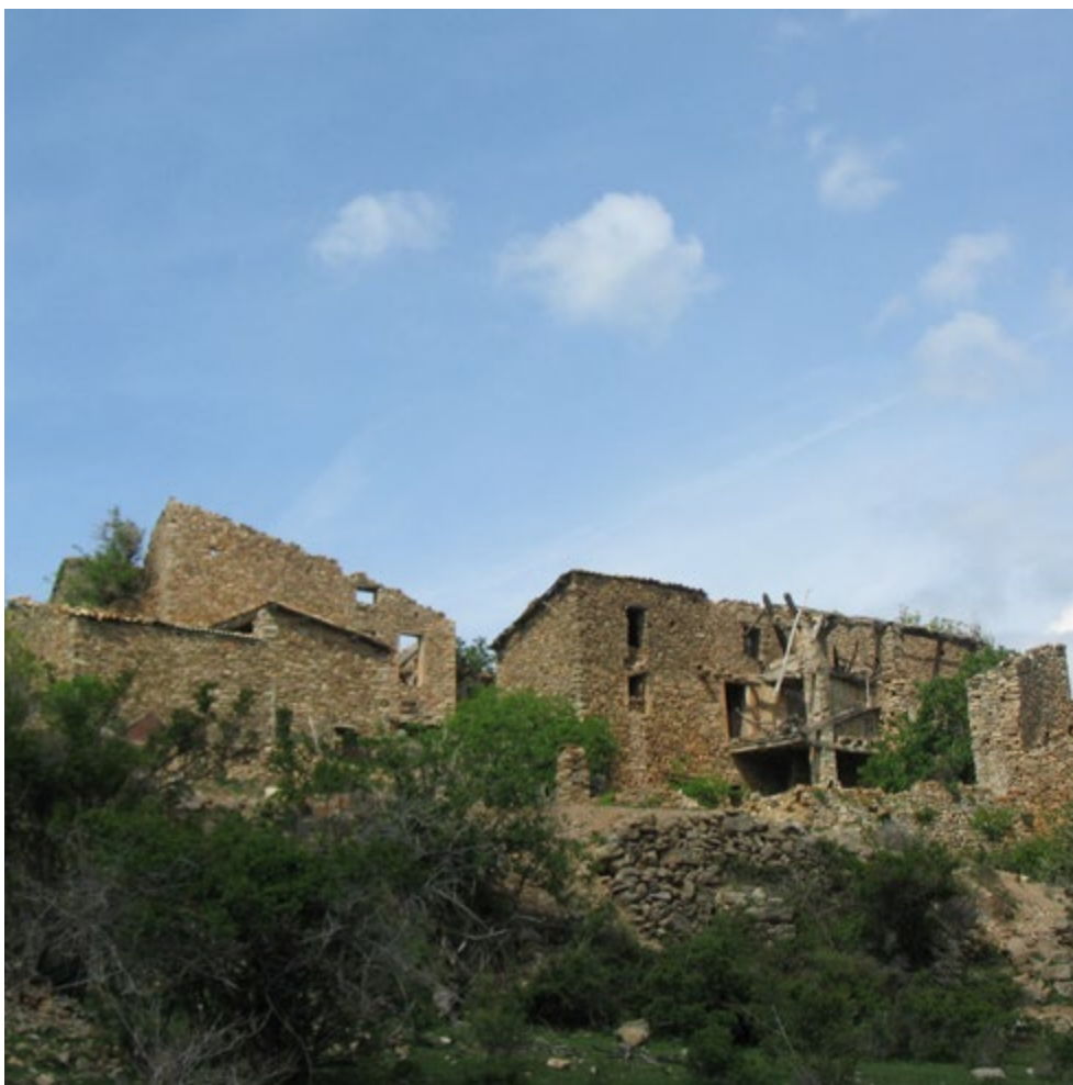
Les polítiques públiques contemporànies han contribuït al despoblament de l'alta muntanya. Buseu (2006). Ismael Vaccaro

Els criteris utilitzats per atorgar l'estatut de municipi atendien a aspectes com les dimensions demogràfiques de les entitats locals, la connectivitat amb els mercats o la viabilitat econòmica. Només aquelles localitats que complien amb aquests requisits van assolir el rang de districte municipal i van esdevenir, d'aquesta manera, beneficiàries potencials dels serveis públics. Les poblacions més petites no van obtenir aquest reconeixement jurídic. Els habitants dels pobles situats als vessants més enlairats es van veure forçats a desplaçar-se fins al fons de les valls per poder satisfer les seves necessitats: en no tenir un accés directe als serveis bàsics, havien de desplaçar-se a les localitats més grans per adquirir subministraments, escolaritzar els fills, fer tota mena de tràmits legals, aconseguir aliats o fins i tot per aparellar-se.