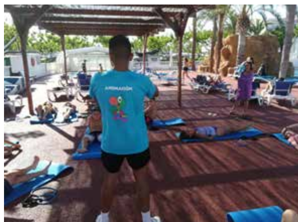
Imagen 3: Dinamización en la empresa con clientes