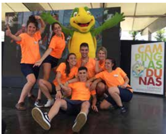
Imagen 2: Grupo de animación de la empresa

-para el docente -que ve que esta tipología de formación como integral, diversa, motivadora, competencial y significativa-.