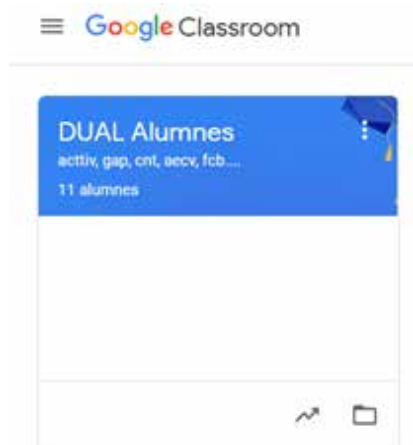
Imagen 4: Vista del Classroom para el seguimiento del alumnado