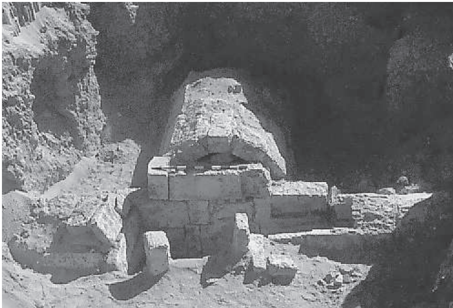
Figura 2. Tomba saïta número 13.

Un altre amulet lligat al món funerari és el pilar djed , que representava la columna vertebral d'Osiris i simbolitzava l'estabilitat. Al sud-oest de la tomba número 1 es localitza la tomba 7, un conjunt de tres cambres cobertes amb volta de canó i pavimentades. A l'estructura inicial de dues cambres se'n va afegir una de més tardana. És en les portes de les dues cambres més antigues on es van localitzar uns textos jeroglífics en pintura vermella, probablement la fórmula de les ofrenes, que flanegen el pilar djed , tocat amb la corona del déu funerari Ptah-Sokar-Osiris.