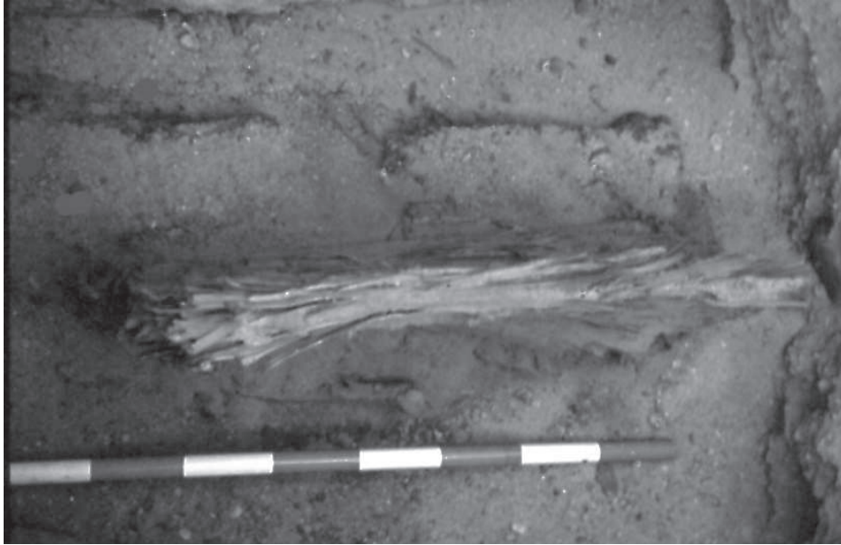
Figura 7. Cementiri tardà de la necròpolis alta.

la realització en totot la distància de casos similars a l'occidental. També és original la forma de les vessants que apunten igualment una certa tendència piramidal. La cronologia exacta de l'enterrament no és encara prou clara tot i estar envoltada d'àmfores, però es tracta d'un repertori molt comú a Egipte des de finals de l'època altimperial fins al Baix Imperi. En qualsevol cas, representa un canvi en la tendència observada a la necròpolis, que estableix un tipus d'enterrament en superfície i individual.