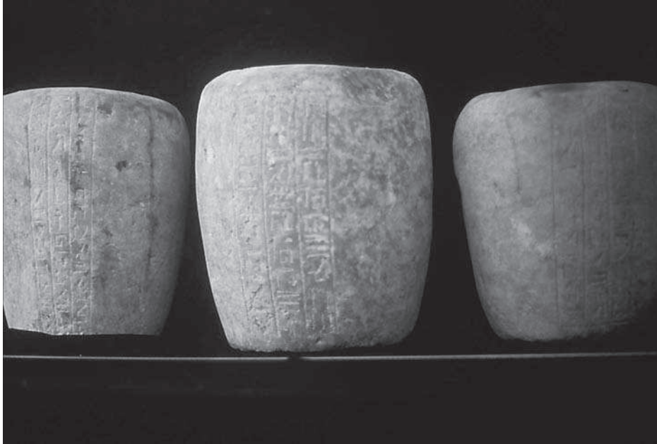
Figura 4. Vasos canops.

junt, visible per un enterrament sense momificar situat en una de les cambres. L'aspecte més curiós és que al fons es van trobar les restes d'un cos momificat que podria tractar-se de la propietària del sarcòfag de la cambra central.