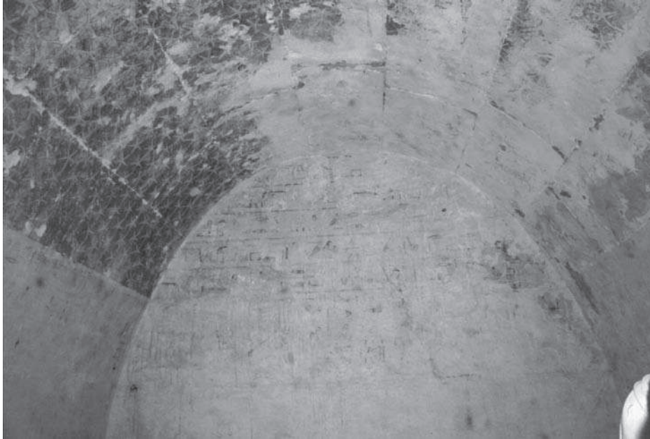
Figura 1. Interior de la cambra 3 de la Tomba saïta número. 1. Detall de les decoracions del sostre i de les parets.

el mort. La protecció física anava acompanyada de la protecció simbòlica, representada per l'orientació de la tomba. A l'època saïta les tombes es poden orientar nord-sud o est-oest, però l'accés a la cambra funerària es fa sempre per la zona dels peus del difunt. No és d'estranyar que les parets situades prop dels peus i a l'entrada de la cambra portin una sèrie fórmules per impedir l'entrada dels mals esperits i dels lladres.