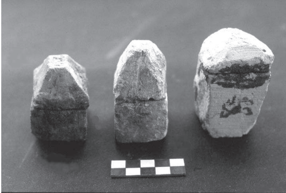
Figura 10. Cubs de pedra calcària que contenen en el seu interior les boletes de fang relacionats amb rituals de protecció.

no poder emportar-se-la. Probablement sigui en aquest espai on es retia culte al déu. En els murs de la sala, folrats amb carreus ben escairats de pedra calcària blanca, els constructors havien dibuixat un seguit de línies paral·leles de color vermell, una preparació per inscriure un text que, malauradament, mai no es va arribar a escriure. En el sol de l'estança es van localitzar una sèrie d'obertures que donaven accés a uns nínxols condicionats en el sòcol de construcció. En molts punts dels murs d'aquesta sala encara es pot veure l'inici de l'arrencament de la volta que devia cobrir l'estança. A l'est d'aquesta cambra se'n troba una altra que encara no ha estat excavada. S'hi accedeix per una porta oberta en l'angle sud-est del conjunt. Les mides d'aquestes dues cambres no s'han pogut completar ja que l'excavació no ha pogut finalitzar-se vers el nord. La part interior dels àmbits està definida per una construcció de pedra calcària que recobreix el buit excavat en la roca, però, en l'estat actual, en alguns punts apareixen a la vista els murs mentre que en altres apareix directament la paret de la roca natural. L'alçada dels murs conservats en ambdues cambres varia entre 50 centímetres i 2,50 metres. La coberta hauria de ser de pedra escairada i amb volta que avui ha desaparegut, de manera que queda a la vista la roca foradada i les obertures de ventilació i il·luminació.