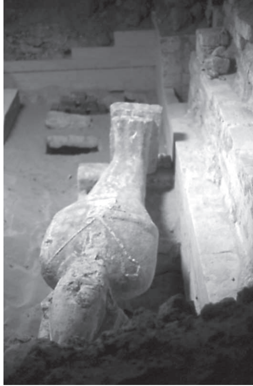
Figura 9. Sala amb estàtua del déu Osiris.

evidència un conjunt coherent d'estructures subterrànies, que probablement havien estat relacionades amb un temple avui desaparegut. El nom d'aquest monument, Per-Khef, era ja conegut per altres fonts, però mai, fins al moment, no s'havia obtingut cap indicació sobre el seu emplaçament exacte. Es tracta d'un recinte cultural i de la necròpolis d'Osiris a Oxirinc. Un estudi acurat ha permès relacionar-lo amb uns blocs decorats vistos pel professor Serge Sauneron en els anys cinquanta en el mercat d'antiguitats.