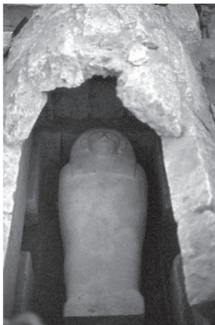
Figura 3. Sarcòfag femení dins la cambra principal de la tomba número 13.

Molt a prop d'aquesta tomba, a tres metres de profunditat d'unes estructures de tovot d'una necròpolis copta, va aparèixer una nova estructura funerària (figura 2). Aquesta tomba consta d'un petit vestíbul on apareixen disposades en creu una cambra principal en l'eix major i dues laterals annexes. La tomba es trobava saquejada i no s'hi va poder localitzar el pou d'accés. Cap al nord del suposat pou d'accés apareix una nova cambra que sembla completar el conjunt. La cambra major situada al sud té planta rectangular. Està coberta amb una volta de canó i conté un sarcòfag antropomorf de pedra dura sense inscripcions (figura 3), tot i que als seus peus s'aprecia l'inici d'una banda vertical on normalment s'inscrivien els textos funeraris. El modelatge del rostre es va fer amb molta cura i mostra les característiques estilístiques pròpies de l'època saïta. La cara mostra uns trets delicats, femenins, només alterats pel fet que el nas ha patit alguna destrossa. Malauradament, un forat als carreus de la volta, la tapa desplaçada del sarcòfag i l'interior buit demostren que la tomba havia estat saquejada ja a l'antiguitat.