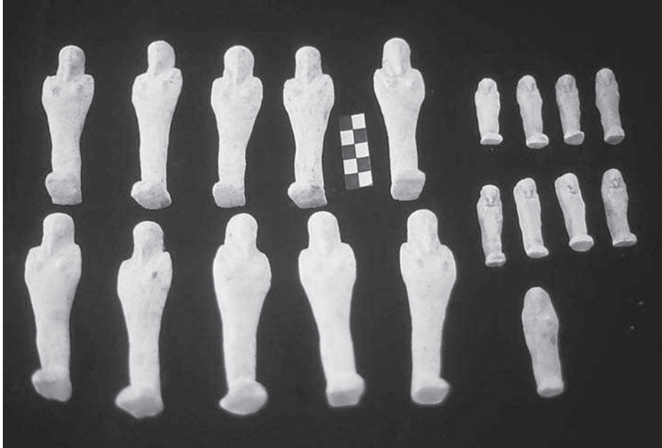
Figura 5. Uixebtis .

tapadora pren la forma d'aquestes divinitats. Quatre òrgans (el fetge, el pulmó, l'estómac i els budells) es dipositaven a l'interior dels vasos fins a finals de l'Imperi Nou, quan tornen a col·locar-se dins les mòmies, un cop momificats. Però aquest fet canvia amb l'arribada de la dinastia XXVI, quan tornen a posar-se de moda i les vísceres es col·loquen a l'interior. Ara cada gerra té la seva particular composició de textos referents a la divinitat protectora. En la nova cala oberta al sud-est de la necròpolis han aparegut diversos vasos canops, així com fragments de vasos. Els més destacats són tres vasos d'època saïta d'alabastre, amb inscripcions jeroglífiques en tres columnes separades per línies. Poden tenir el nom, títols, matronímic, amb la forma que correspon. També s'han exhumat tres tapadores de vasos canops d'alabastre: una amb la representació humana (Amset), una altra amb la representació d'un xacal (Duamutef) i la tercera amb la representació d'un babuí (Hapi). Una quarta tapadora de vas canop de dimensions més petites i de pedra calcària representa un falcó (Qebsenuf).