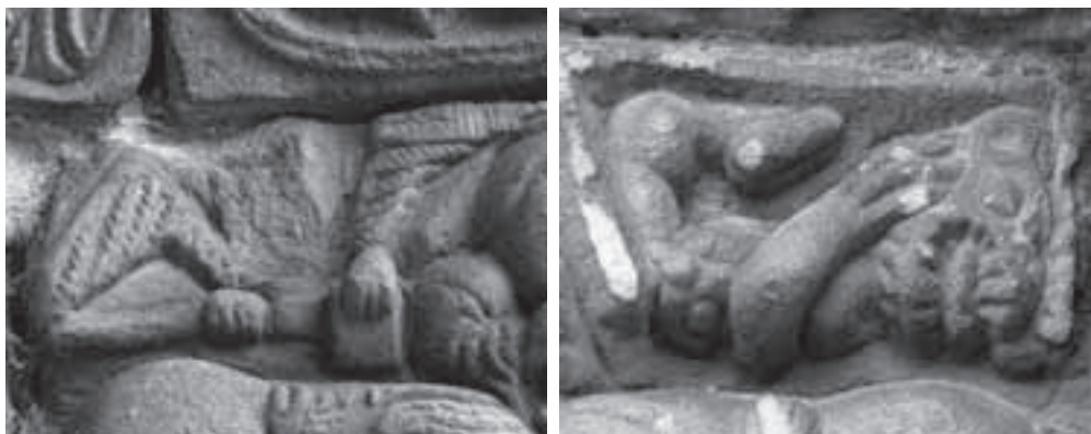
Fig. 17 y 18: Detalles del capitel interior del lado este de la portada de Yermo.

Respecto al enigmático personaje que hay a la derecha de Daniel, y que García Guinea califica de demonio de espantoso rostro y Jesús Herrero como de demonio vencido por el poder de la oración, la única alternativa verosímil que se nos ocurre está relacionada con una mención que se realiza en el texto bíblico en referencia a la alimentación de los leones, (Daniel 14, 32) en el que se afirma que Daban a los leones cada día dos cuerpos humanos y dos ovejas . Observando la fig. 18 se puede apreciar como los dos miembros arrancados junto a la feroz cabeza animal parecen un brazo humano y una pata de cuadrúpedo, posiblemente un bóvido o una oveja. De ser así, esta cita, nos estaría introduciendo un presunto elemento exclusivo correspondiente al episodio descrito en Daniel 14. Sin embargo, su escasa relevancia respecto al mensaje interpretativo no creemos que debiera llevarnos a interpretar la escena representada en Yermo como la segunda condena al foso.