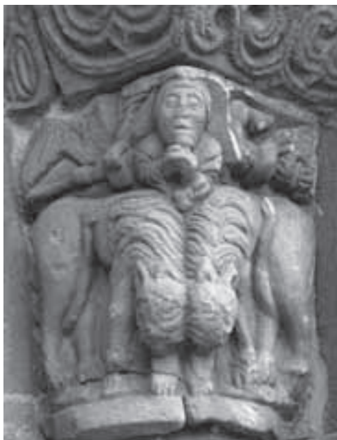
Fig. 13: Capitel interior del lado este de la portada de yermo.