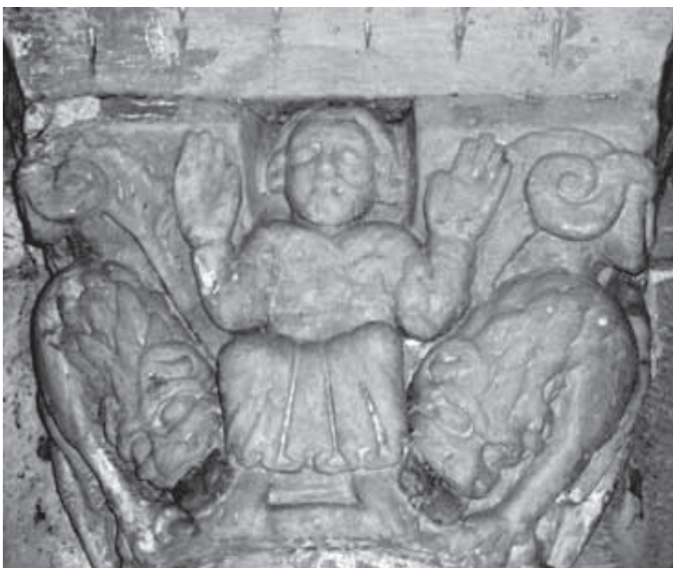
Fig. 3: Capitel con Daniel en el foso de la iglesia de Santa María de Hoyos (Cantabria).

A) Representaciones neutras, las cuales no incorporan ningún elemento identificador exclusivo y, por tanto, son imposibles de asignar unívocamente a ningún episodio. En este grupo está el tipo de representaciones más extendido, el de Daniel escoltado por dos o más leones, no siete, tal y como ocurre en Santa María de Hoyos (fig. 3) y en San Andrés de Rioseco (fig. 4), por citar ejemplos cántabros.