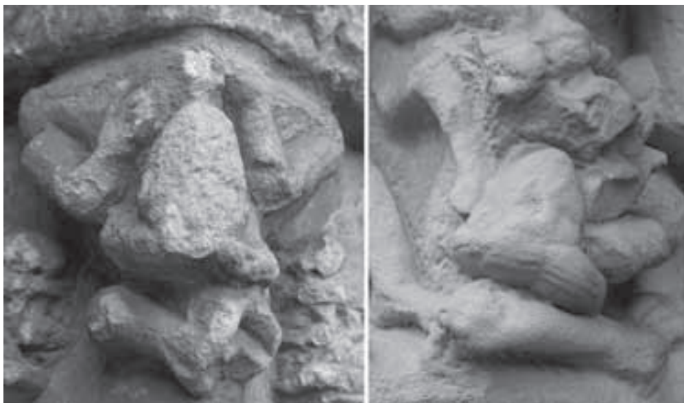
Fig. 15 y 16: Detalle del conjunto de miembros humanos en el capitel de Yermo (Izda.) y el de Santillana del Mar (dcha).