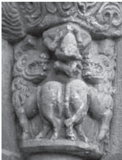
Fig. 14: Capitel exterior del lado este de la portada de yermo.

El capitel exterior del mismo lado (fig. 14), contiene también dos leones colocados de forma simétrica, pero esta vez en actitud amenazante con las fauces abiertas, mientras en la esquina superior aparece un amasijo de miembros humanos muy similar al que hemos podido ver en el capitel del claustro de Santillana del Mar 35 .