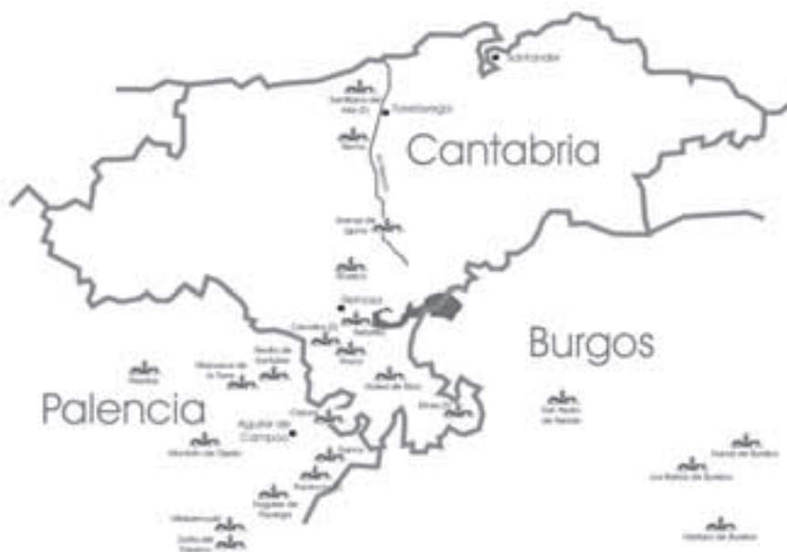
Fig. 1: Mapa de la ubicación de las escenas de Daniel en el foso en Cantabria y norte de Palencia y Burgos.

curioso observar como, desde dicha área, esta iconografía llega a la costa cantábrica a través del valle del río Besaya, en cuyo tramo final encontramos las dos representaciones más interesantes de todo este conjunto, si atendemos a sus peculiaridades iconográficas, Santillana del Mar y Yermo.