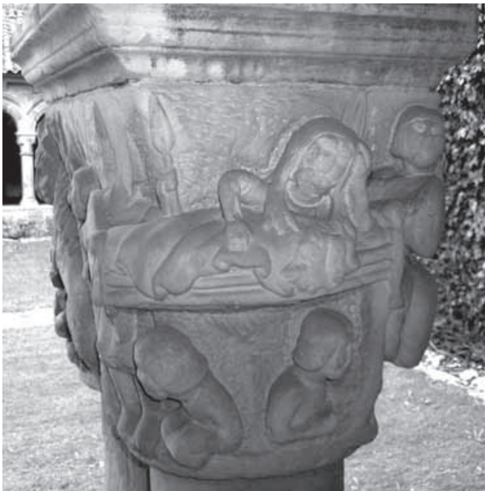
Fig. 6: Cara sur del capitel del claustro de la colegiata de Santa Juliana de Santillana del Mar (Cantabria).