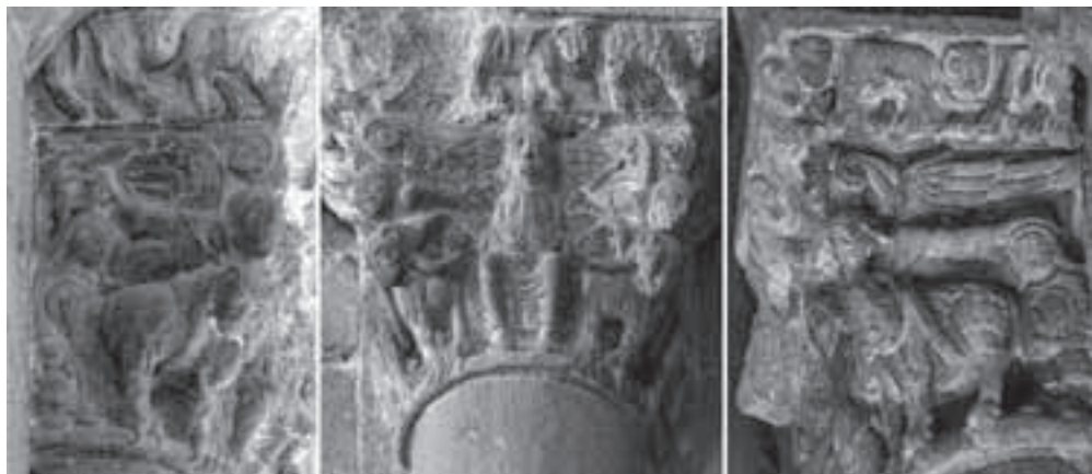
Fig. 8: Tres caras del capitel de la iglesia del castillo de Loarre (Huesca).

La modalidad más frecuentemente utilizada para plasmar el auxilio de Habacuc es la que representa al ángel en pleno vuelo cogiendo por los cabellos al profeta, quien porta una marmita y un pan. Esta es la forma como aparece en la Biblia de Roda, en una miniatura de Dijon, en el capitel de Neuilly-en-Dun o en el relieve de la portada de Ydes (Cantal, Francia). Un ejemplo que se adapta a este planteamiento, pero que resulta muy peculiar, es el que fue identificado en 1975 por David L. Simon en un capitel del