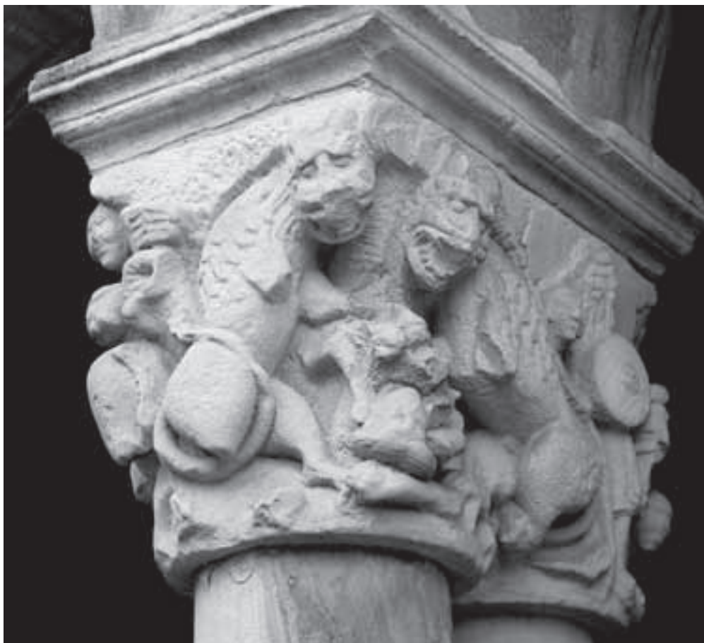
Fig. 7: Caras norte y oeste del claustro de la colegiata de Santa Juliana de Santillana del Mar (Cantabria).

En las siguientes líneas intentaremos dar una explicación coherente a los diferentes elementos que llevan finalmente al profesor García Guinea a adoptar la prudente postura de no pronunciarse respecto a su significado.