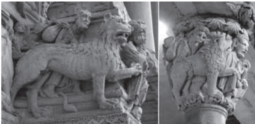
Fig. 9 y 10: Escenas de Daniel en el foso asistido por Habacuc en la portada de Saint-Trophime de Arles (Francia) (izda.) y en un capitel del coro del duomo de Módena (Italia)(dcha.).

Esta modalidad que representa de forma secuencial el viaje de Habacuc no es exclusiva de Loarre. Un capitel del interior del baptisterio de Parma recoge claramente tanto el viaje de ida a Babilonia, como el de vuelta a Judea, sin que exista ninguna duda sobre el sentido de regreso de este segundo viaje, gracias a la diferente orientación de leones y ángel. En el salterio de Saint Albans, conservado en la iglesia de Saint Godehar de Hildesheim (Alemania), en su folio 379, en la decoración de una letra capital aparecen representados el momento en el que el ángel recoge a Habacuc en Judea y el instante en el que ambos llegan a Babilonia. Otro ejemplo podemos verlo en un capitel de la galería norte de la abadía de Moissac (Tarn-et-Garonne, Francia), en el que el ángel recoge a Habacuc y le señala con la mano el camino a Babilonia, representada por una torre, al otro lado de la cual aparece de nuevo Habacuc sosteniendo con las dos manos el recipiente que ofrece a Daniel.