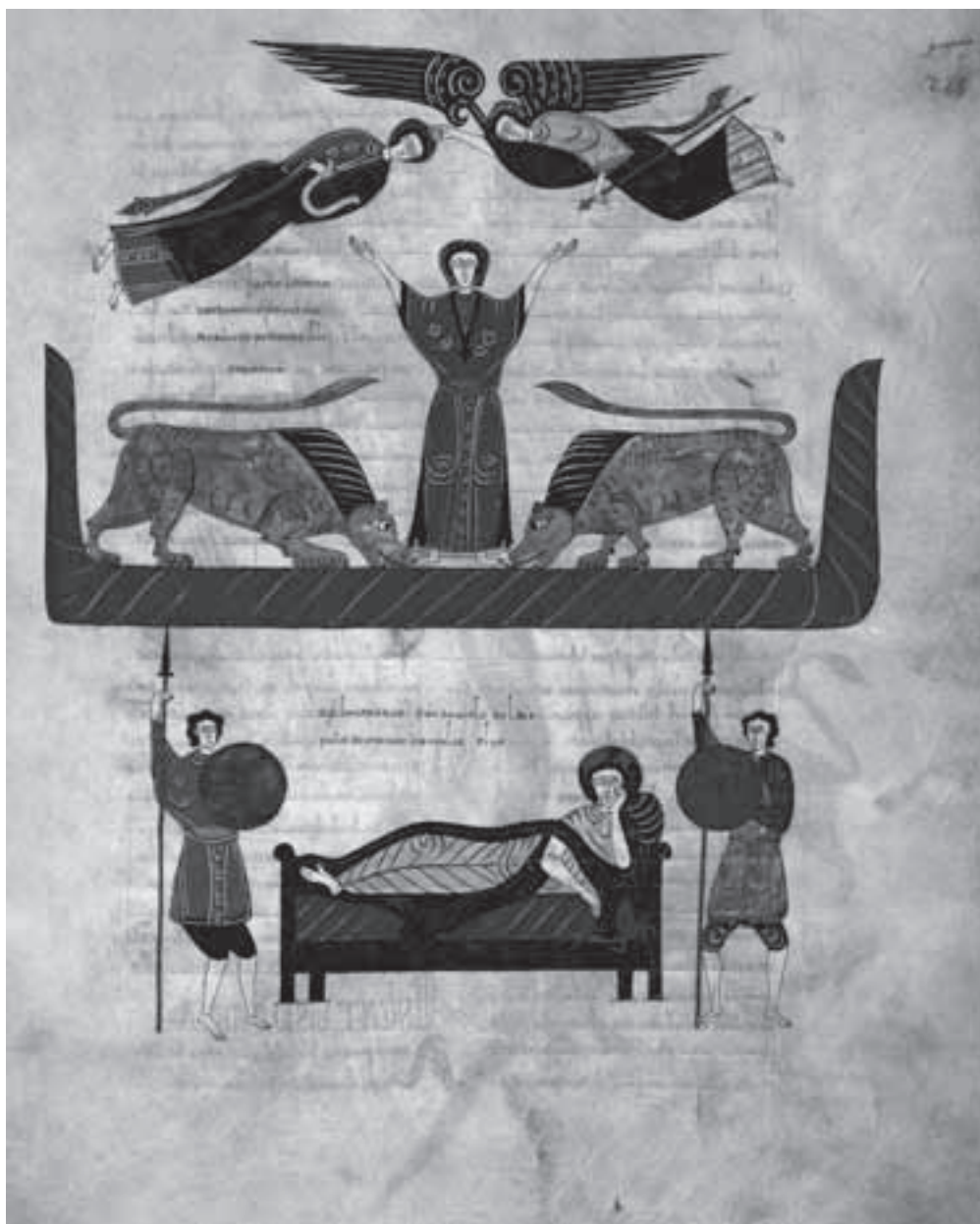
Fig. 11: Beato de Fernando I y Doña Sancha, Ms. Vit. 14-2, Biblioteca Nacional de Madrid, f 286r.