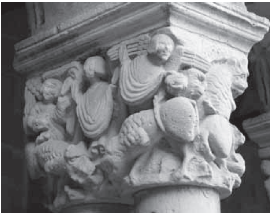
Fig. 5: Cara este del claustro de la colegiata de Santa Juliana de Santillana del Mar (Cantabria).

En la cara este una figura humana con casulla y los brazos en actitud orante ocupa la parte central de la escena (fig. 5). Es escoltado por dos leones que le lamen los pies. A su izquierda un ángel lleva del cabello a un personaje que aparece inclinado, mientras