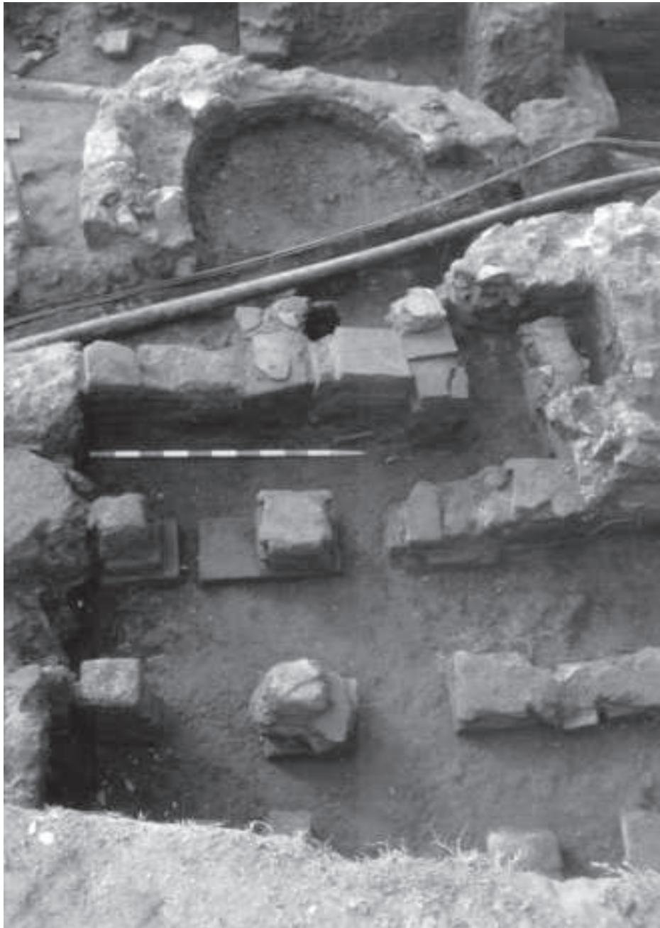
Figura 2. Detall d'una estança i una exedra de la fase III amb la superposició d'un hipocaust de la fase IV.