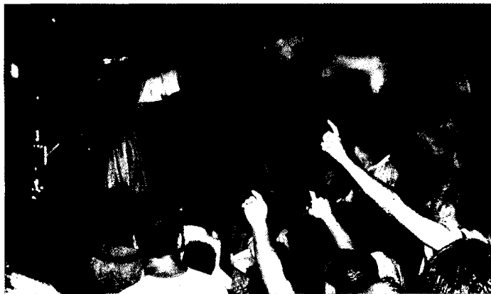
L'últim dissabte de juliol, la "Festa" de Sant Domènec

I Cassar, en diferents moments del llibre, emfasitza el fet que aquesta història és una història escrita en la mateixa època dels Cavallers de l'Orde de Saint John. Sobretot, ens diu l'autor, després de l'experiència traumàtica del setge turc i de les noves relacions, significatives políticament, que sorgeixen a nivell nacional, emergeixen tota una sèrie d'autors que escriuen la història des del punt de vista de l'Orde (: 231).