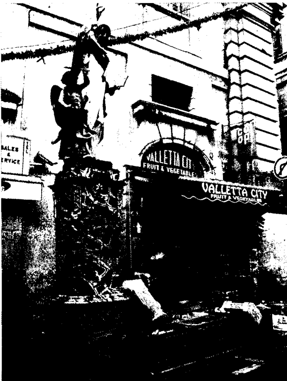
Valleta (Malta) 2004

Una idea important aquí és que al costat d'aquesta història escrita des de la perspectiva de l'Orde, que és la que es convertí en dominant i la que ha passat en certa manera a la memòria col·lectiva, hi ha tota una sèrie d'autors que a la mateixa època escriuen una versió de la història distinta. Es tracta d'una història crítica amb la