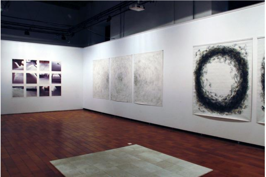
Imatge 1. Vista de l'exposició «Dibuixar el temps» (2020) a l'Escola d'Art de Vic.

L'exposició "Dibuixar el temps. Fina Padrós" va ser coorganitzada amb l'Escola d'Art de Vic, l'Escola Superior de Disseny i d'Arts Plàstiques de Catalunya i la Facultat de Belles Arts de la Universitat de Barcelona, va comptar amb la col·laboració de l'editorial Camí de Marges i el suport d'ACVIC, Centre d'Arts Contemporànies.