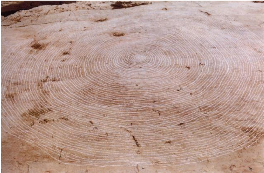
Imatge 3. F. Padrós (2001), Espiral II [guix sobre pedra, 300 × 300 cm (aprox.)]. Intervenció al riu Ter, Montesquiú.