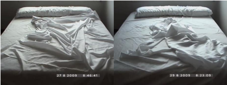
Imatge 5. Dos fotogrames de la sèrie Matins , de F. Padrós (2009) [vídeo, 5 min. c/u].