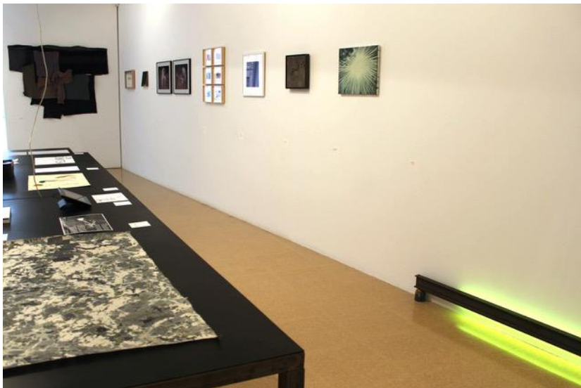
Imatge 4. Vista de l'exposició «Dibuixar el temps» (2020) a l'ACVIC, Centre d'Arts Contemporànies, Vic.