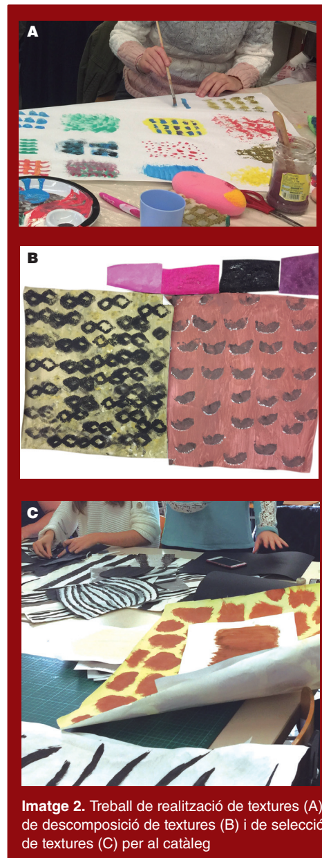
Imatge 2. Treball de realització de textures (A), de descomposició de textures (B) i de selecció de textures (C) per al catàleg

Els reptes són difícils –per això són reptes–, però, un cop superats, la dificultat és directament proporcional a la satisfacció posterior