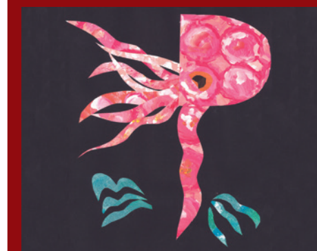
Imatge 1. Animal desestructurat seguint les seves textures