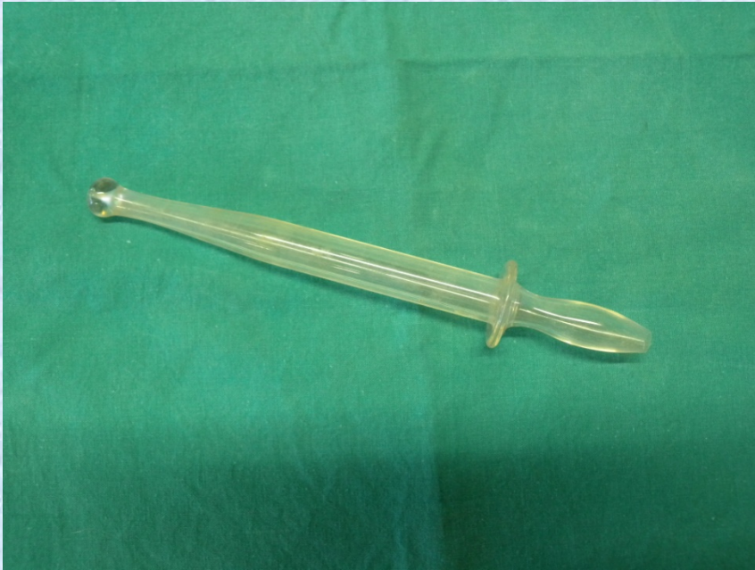
Ubicació: Exposició EUI de la UB